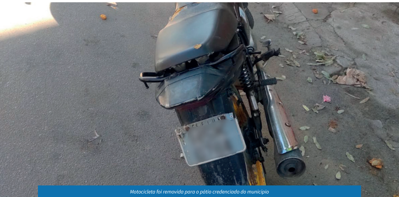
Motocicleta foi removida para o pátio credenciado do município