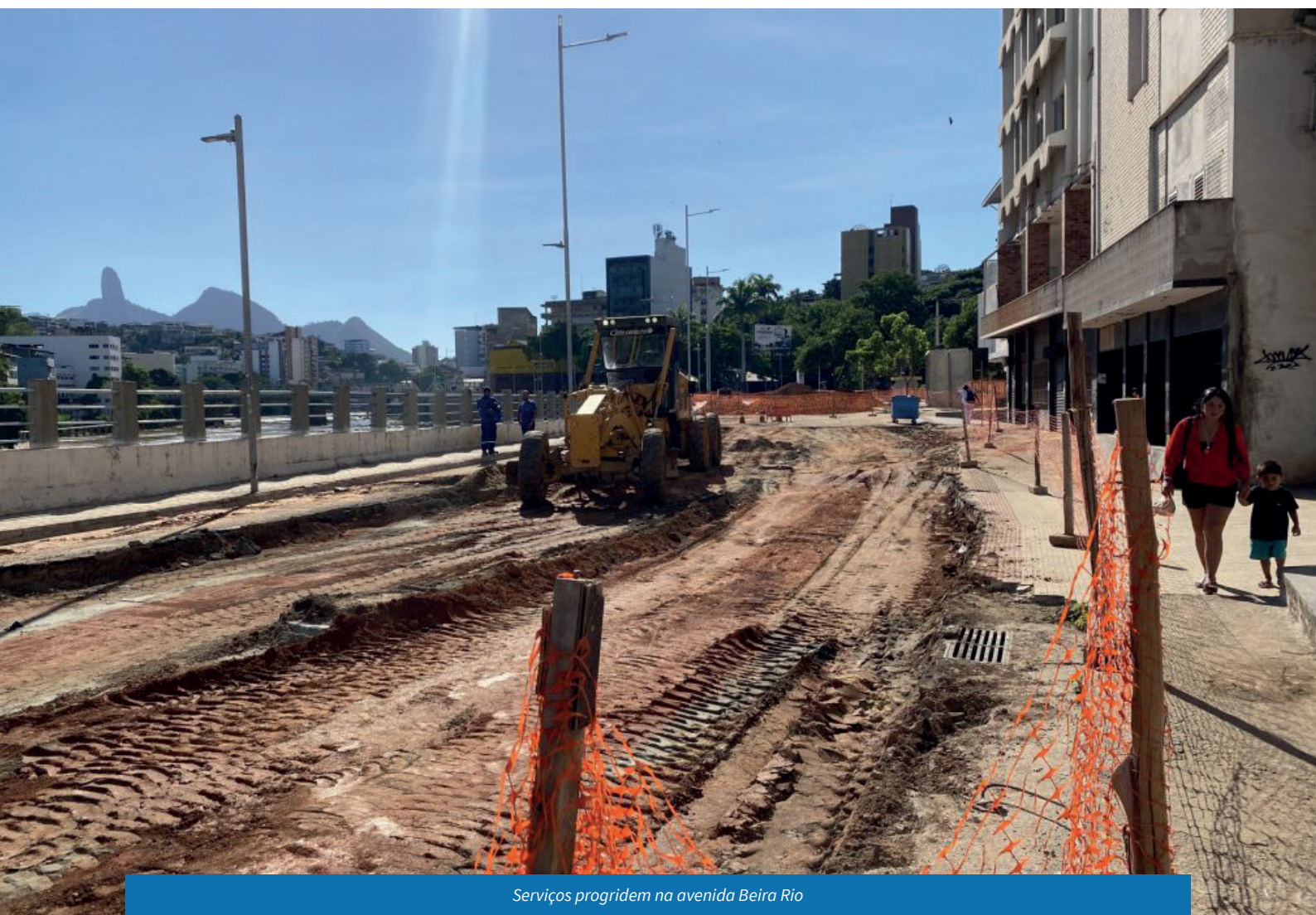
Serviços progredem na avenida Beira Rio

Em números totais, são quase quatro quilômetros de estruturas, entre galerias de concreto e manilhas de PEAD – material com maior flexibilidade e resistência – que irão ampliar, significativamente, a capacidade da rede de drenagem do município. Alguns dos pontos que serão contemplados não contam com nenhum elemento para escoamento da água das chuvas.