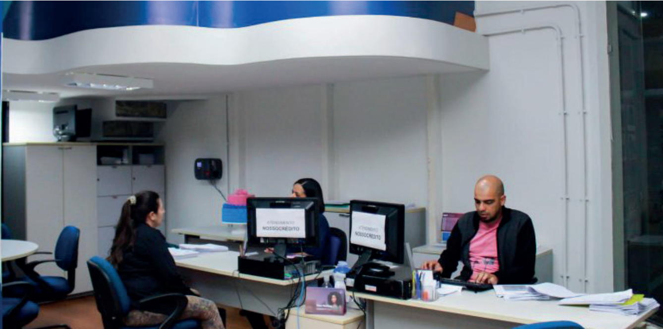
Espaço funciona no segundo piso do Shopping Cachoeiro, Centro