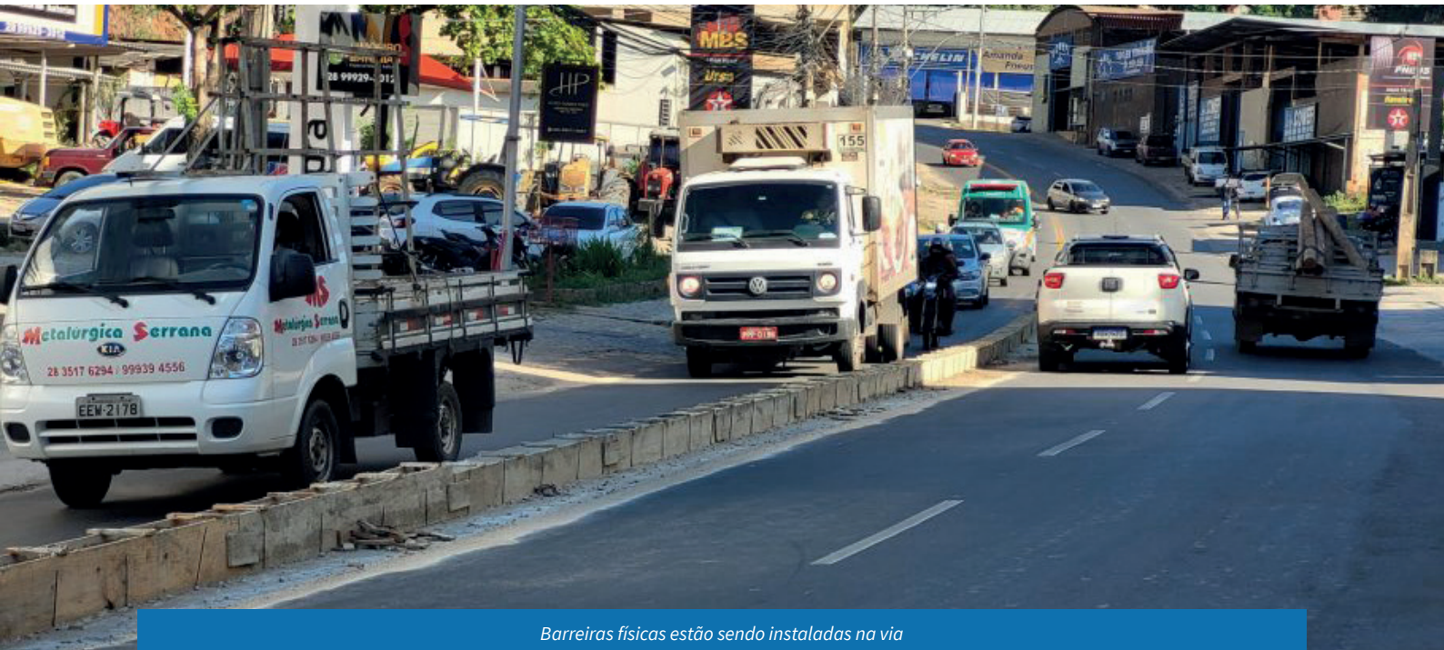
Barreiras físicas estão sendo instaladas na via