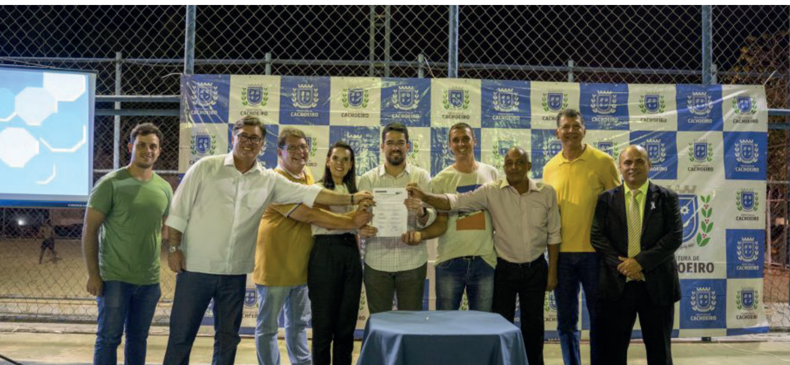
Solenidade de assinatura da ordem de serviço foi realizada na noite da última terça-feira (5)