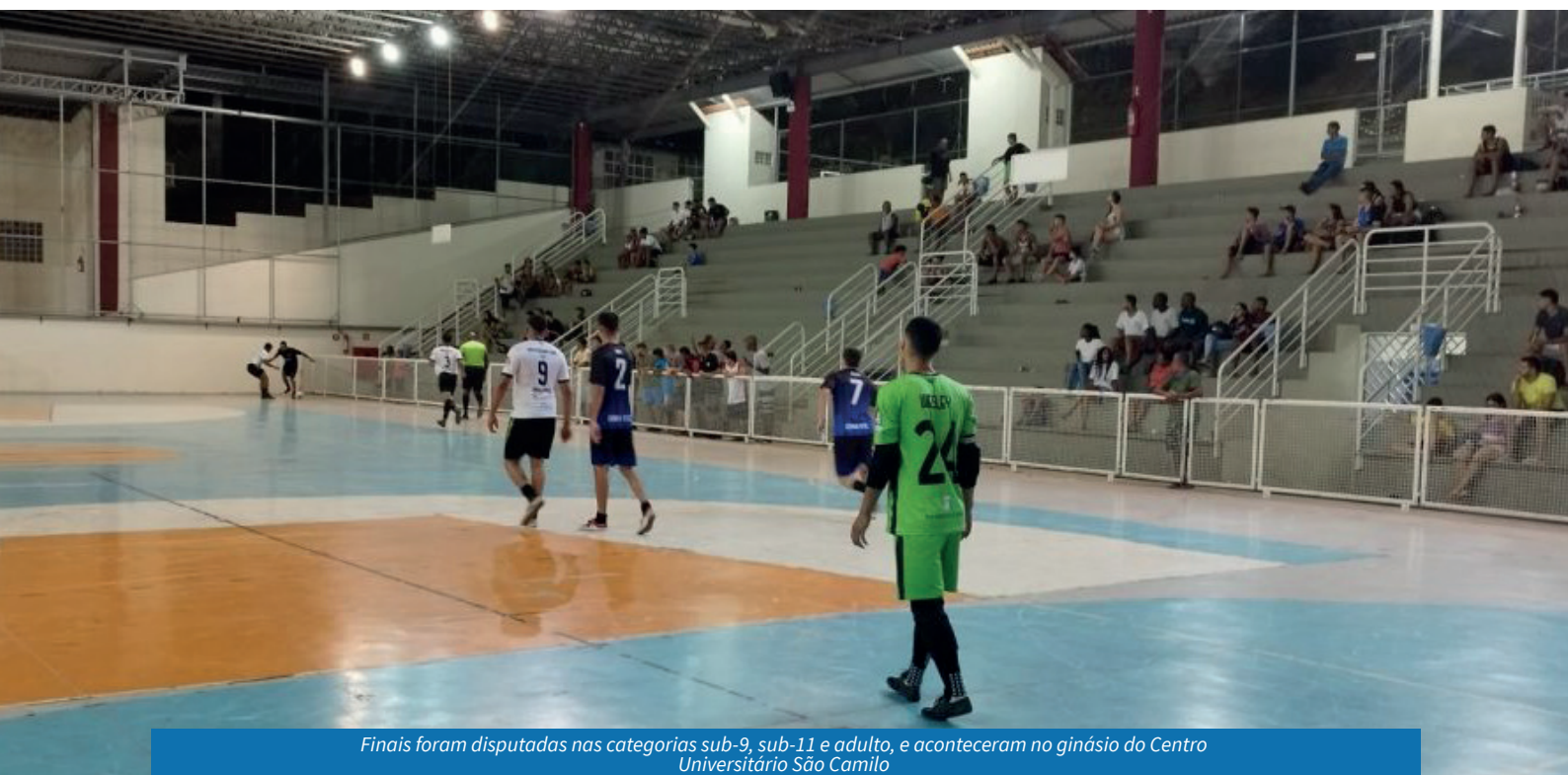
Finais foram disputadas nas categorias sub-9, sub-11 e adulto, e aconteceram no ginásio do Centro Universitário São Camilo