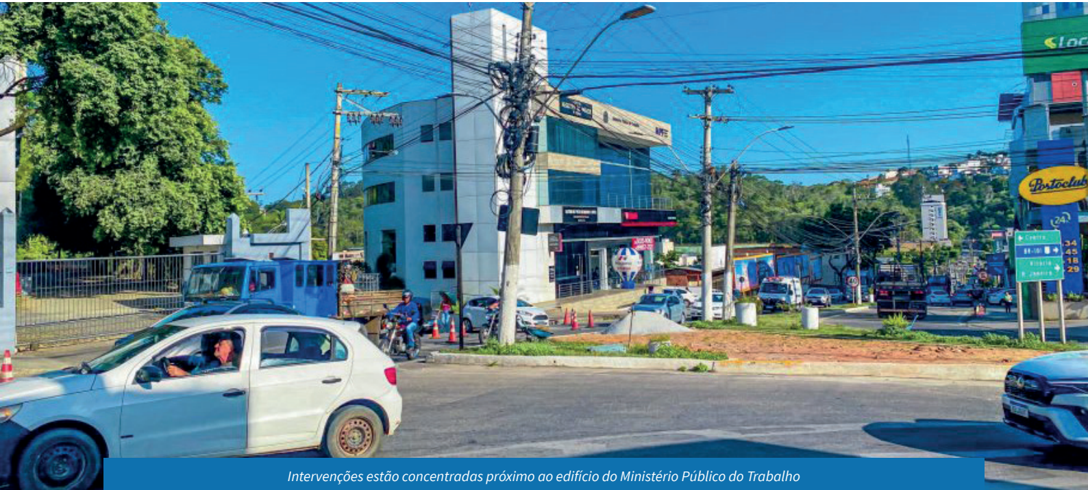
Intervenções estão concentradas próximo ao edifício do Ministério Público do Trabalho