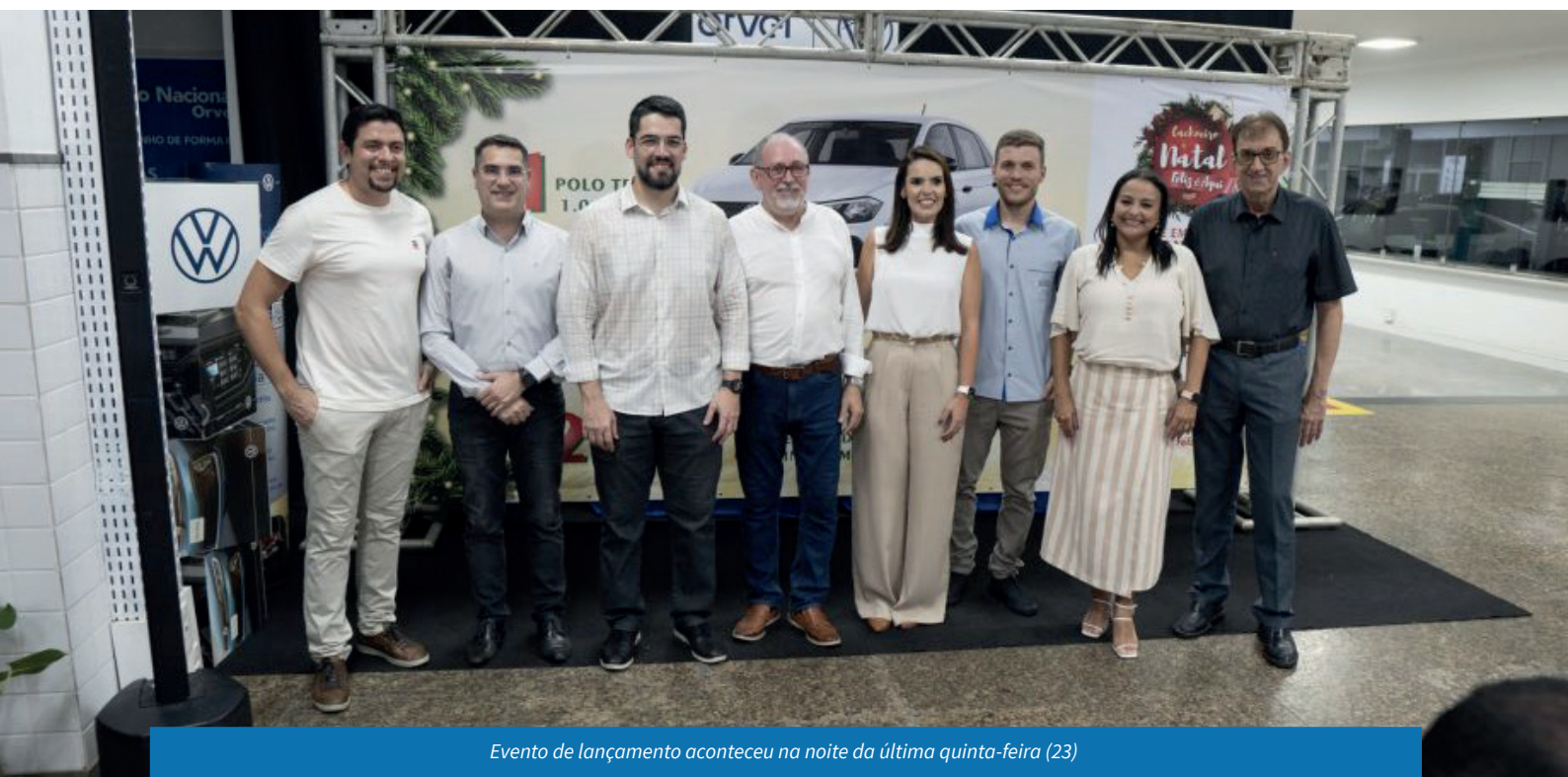
Evento de lançamento aconteceu na noite da última quinta-feira (23)