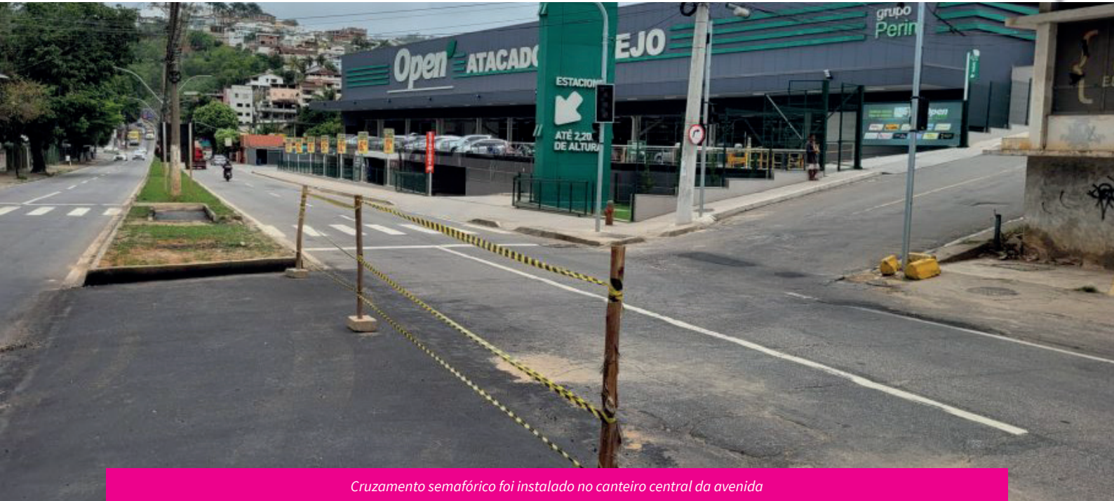
Cruzamento semafórico foi instalado no canteiro central da avenida