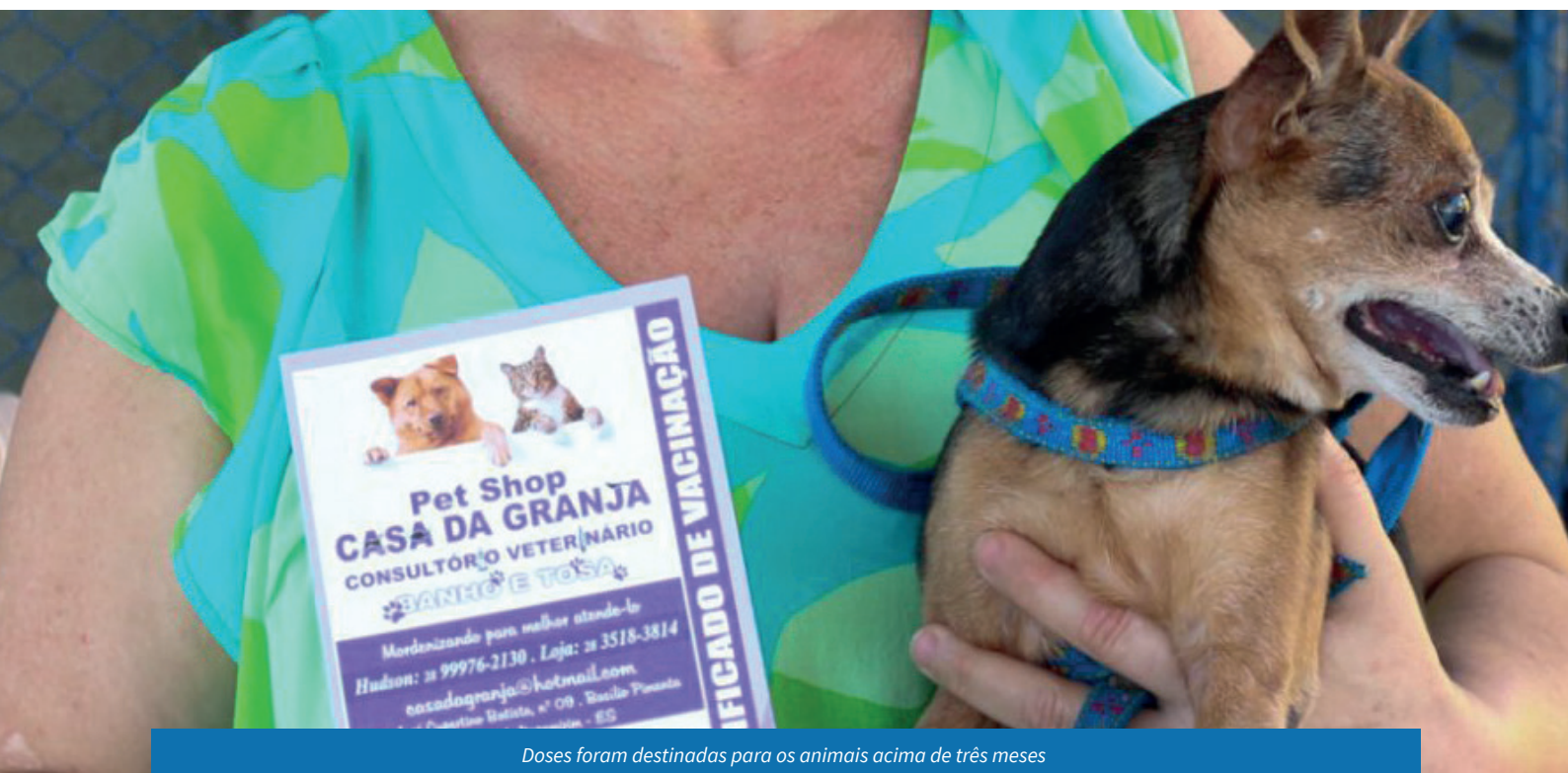
Doses foram destinadas para os animais acima de três meses