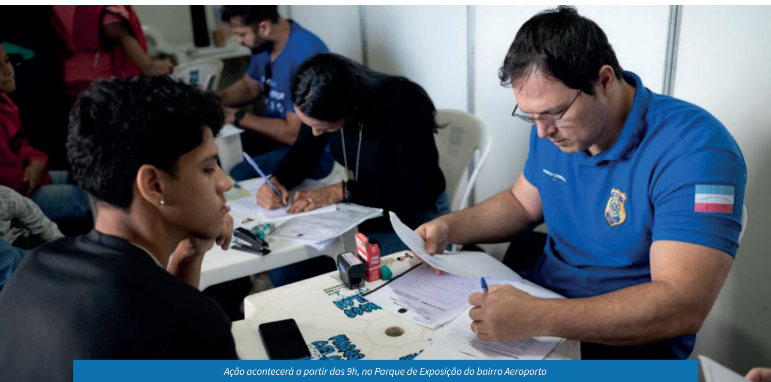
Ação acontecerá a partir das 9h, no Parque de Exposição do bairro Aeroporto