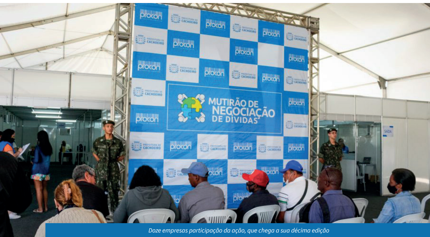
Doze empresas participação da ação, que chega a sua décima edição