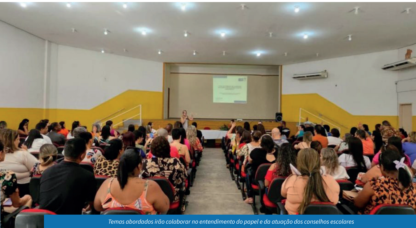
Temas abordados irão colaborar no entendimento do papel e da atuação dos conselhos escolares