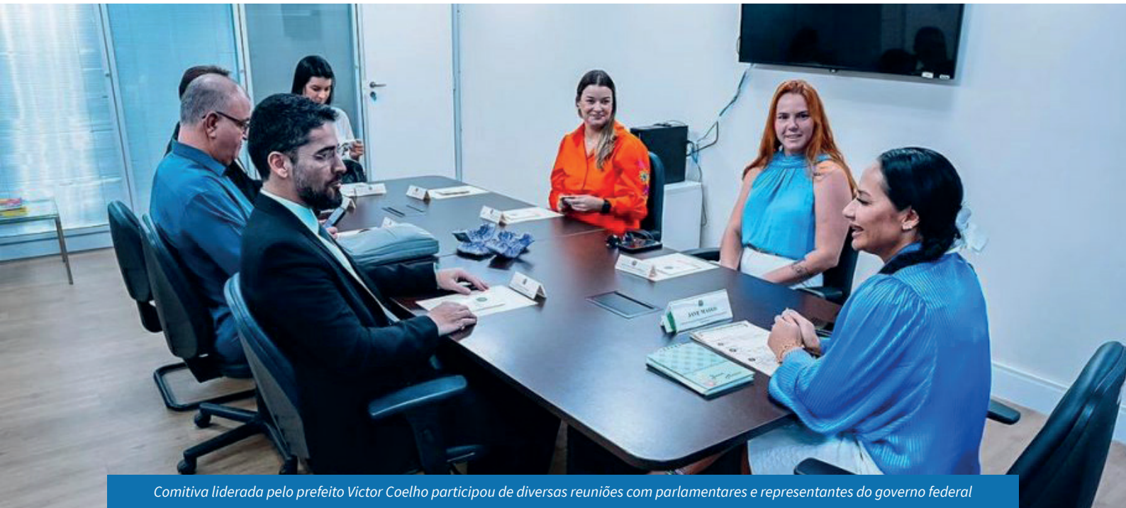
Comitiva liderada pelo prefeito Victor Coelho participou de diversas reuniões com parlamentares e representantes do governo federal