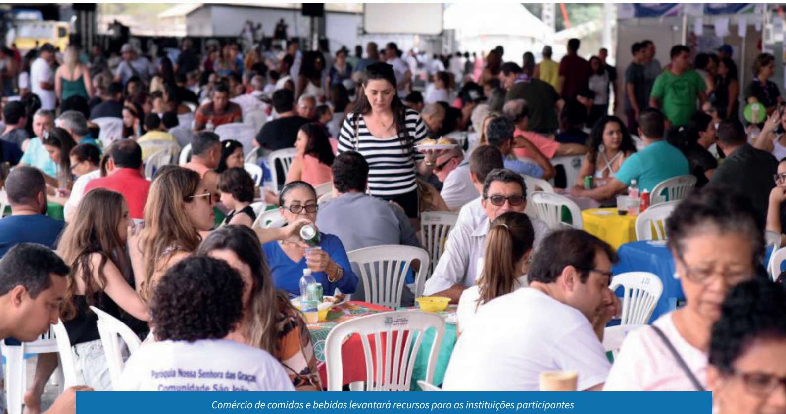
Comércio de comidas e bebidas levantará recursos para as instituições participantes