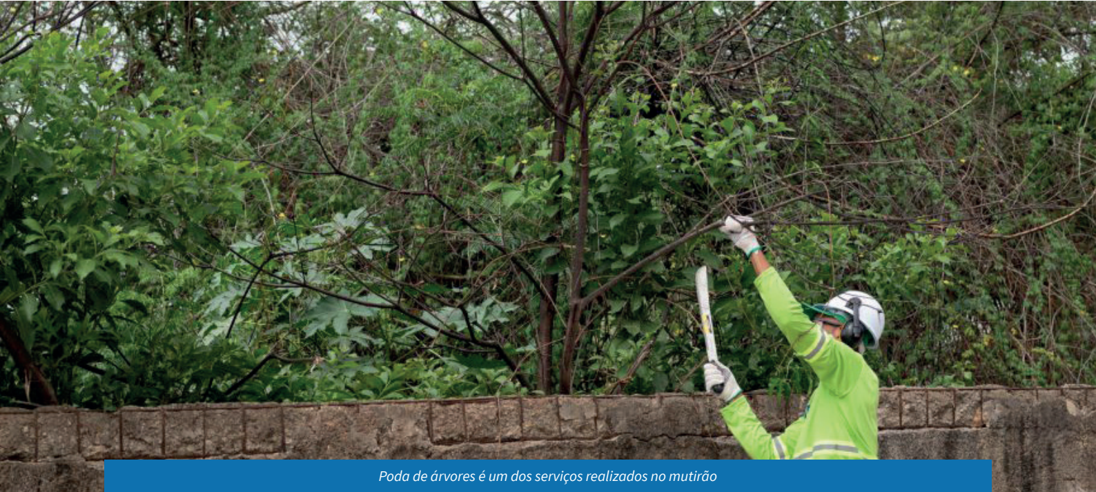
Poda de árvores é um dos serviços realizados no mutirão