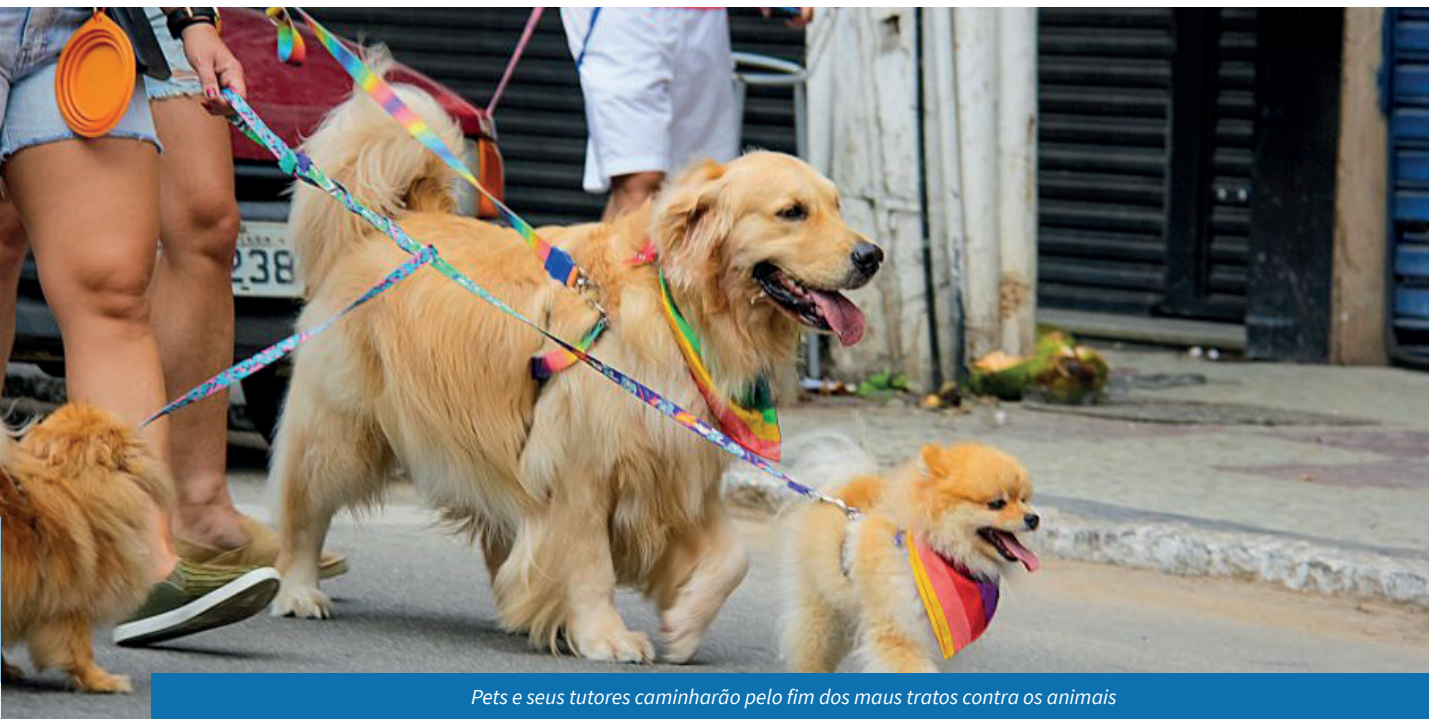
Pets e seus tutores caminharão pelo fim dos maus tratos contra os animais