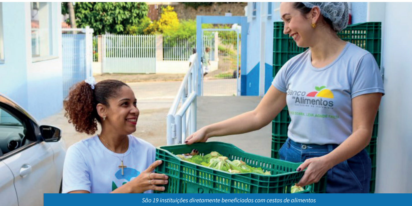
São 19 instituições diretamente beneficiadas com cestas de alimentos