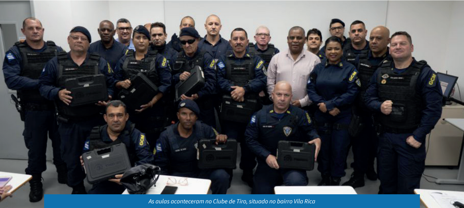
As aulas aconteceram no Clube de Tiro, situado no bairro Vila Rica