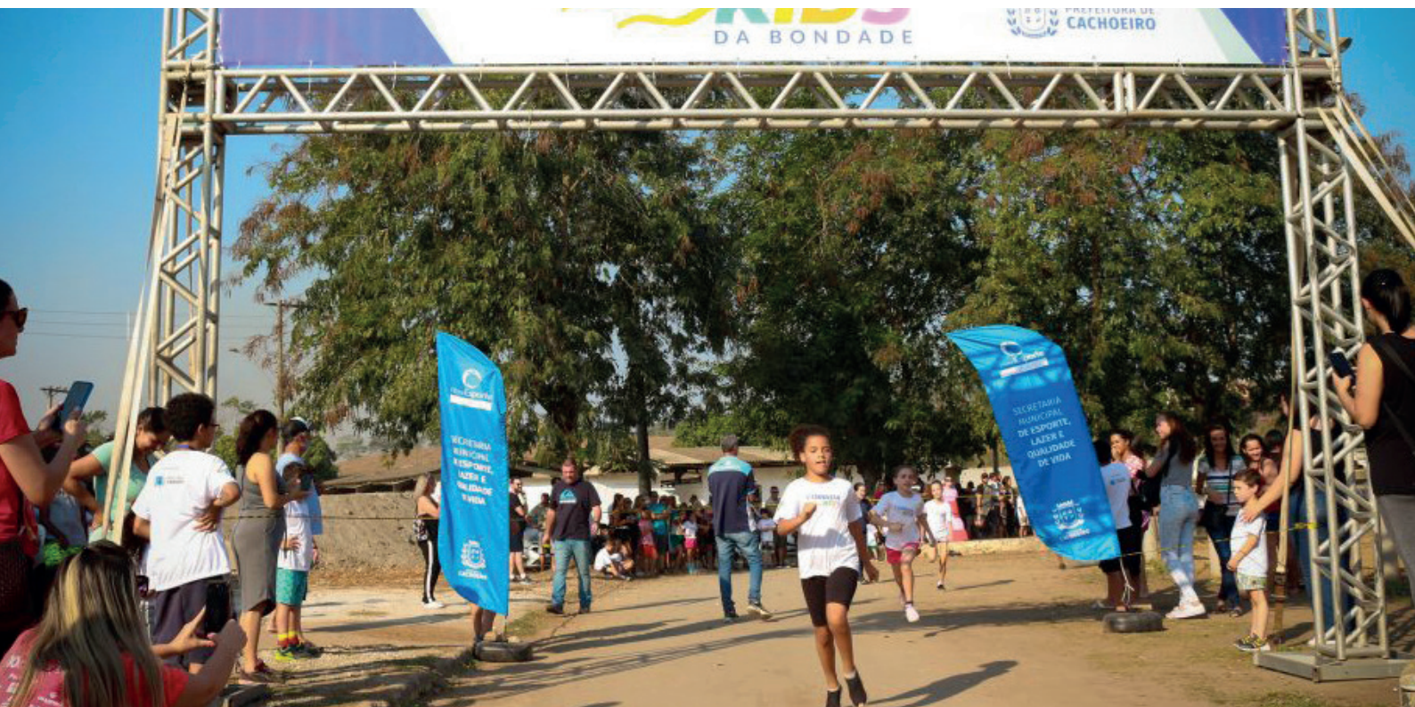
Vão disputar atletas nas categorias, masculino e feminino, sub 11, 12, 14 e 15