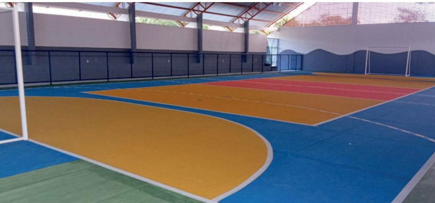
Espaço recebeu pintura interna e externa, melhorias de iluminação e instalação de uma academia ao ar livre