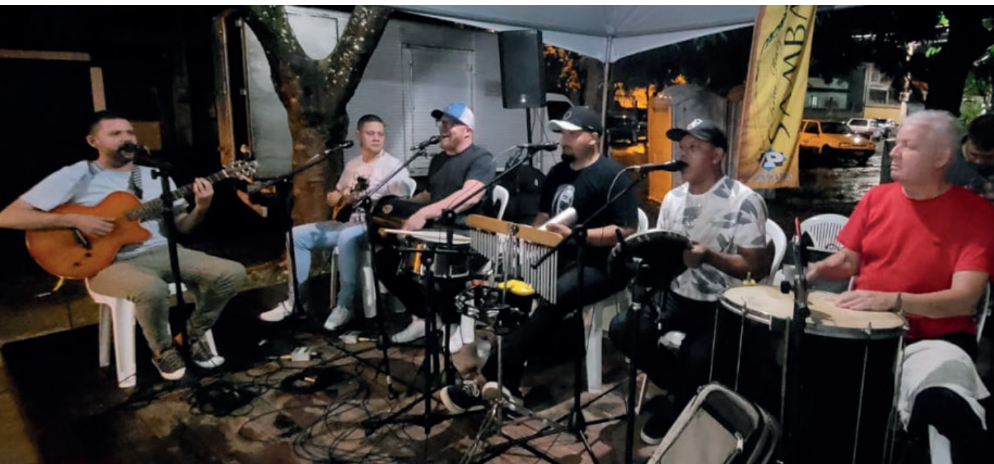
Músico se apresenta com o grupo Fina Raiz no projeto "Sextou na Praça"