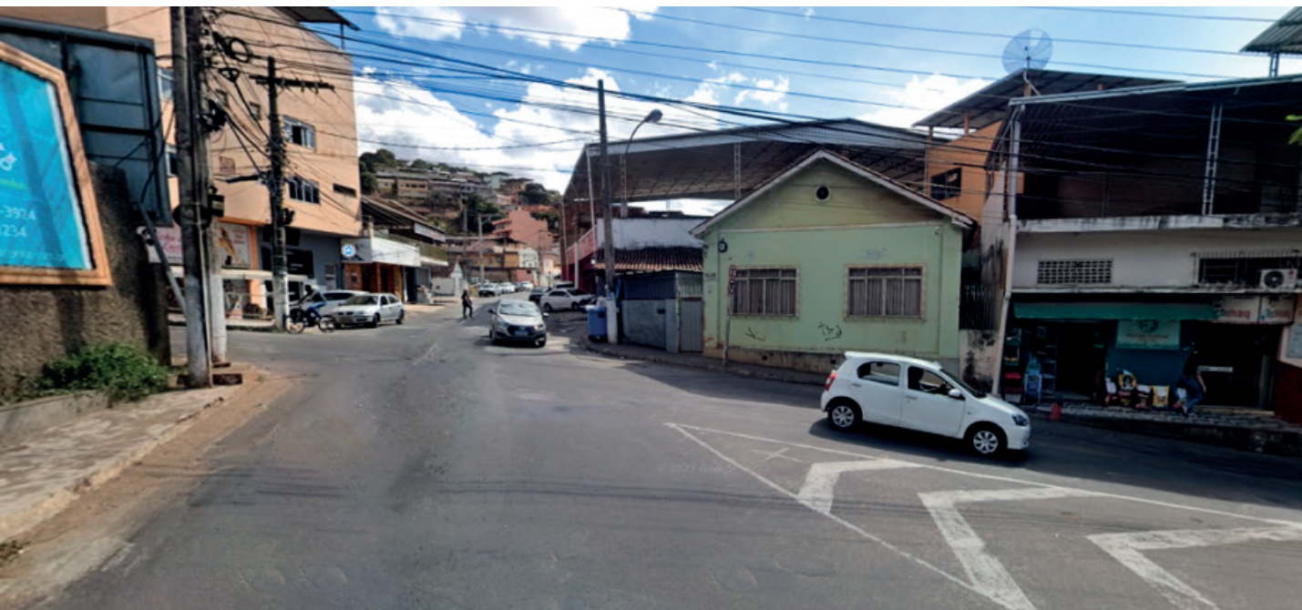
Trecho conecta a região do bairro Basileia com o Centro da cidade