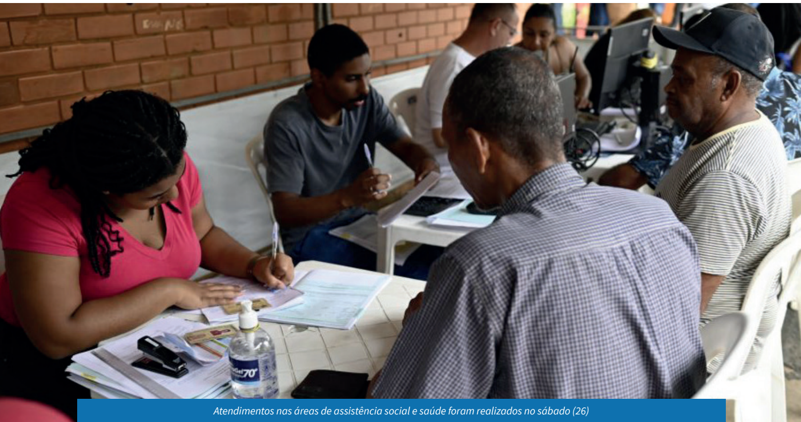
Atendimentos nas áreas de assistência social e saúde foram realizados no sábado (26)