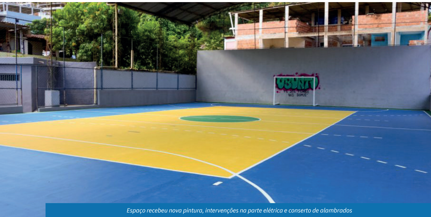
Espaço recebeu nova pintura, intervenções na parte elétrica e conserto de alambrados