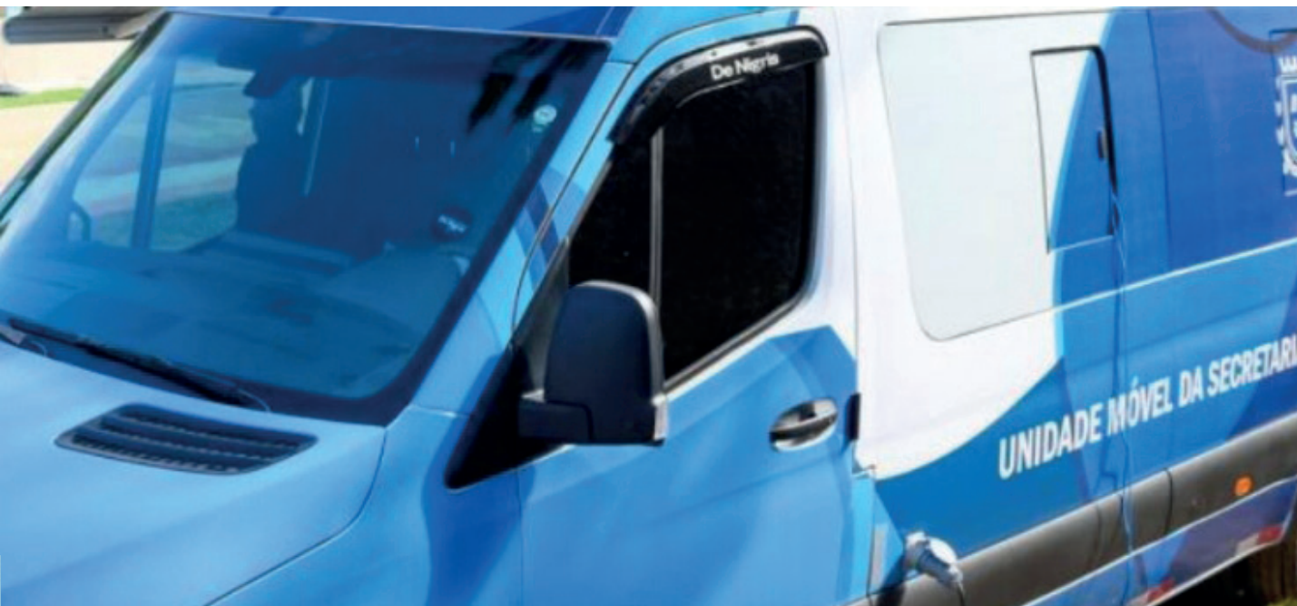
Será o quarto bairro visitado pela unidade móvel da Secretaria de Fazenda