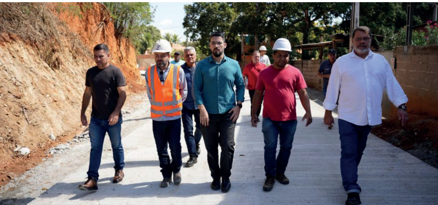
Prefeito Victor Coelho vistoriou o andamento das obras nesta segunda-feira (31)