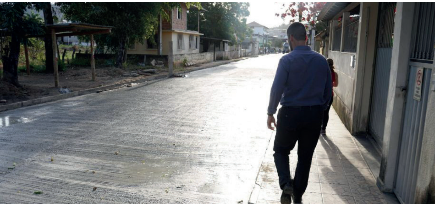
Nesta quinta-feira (27), serviço foi feito na rua Clemente Sartório