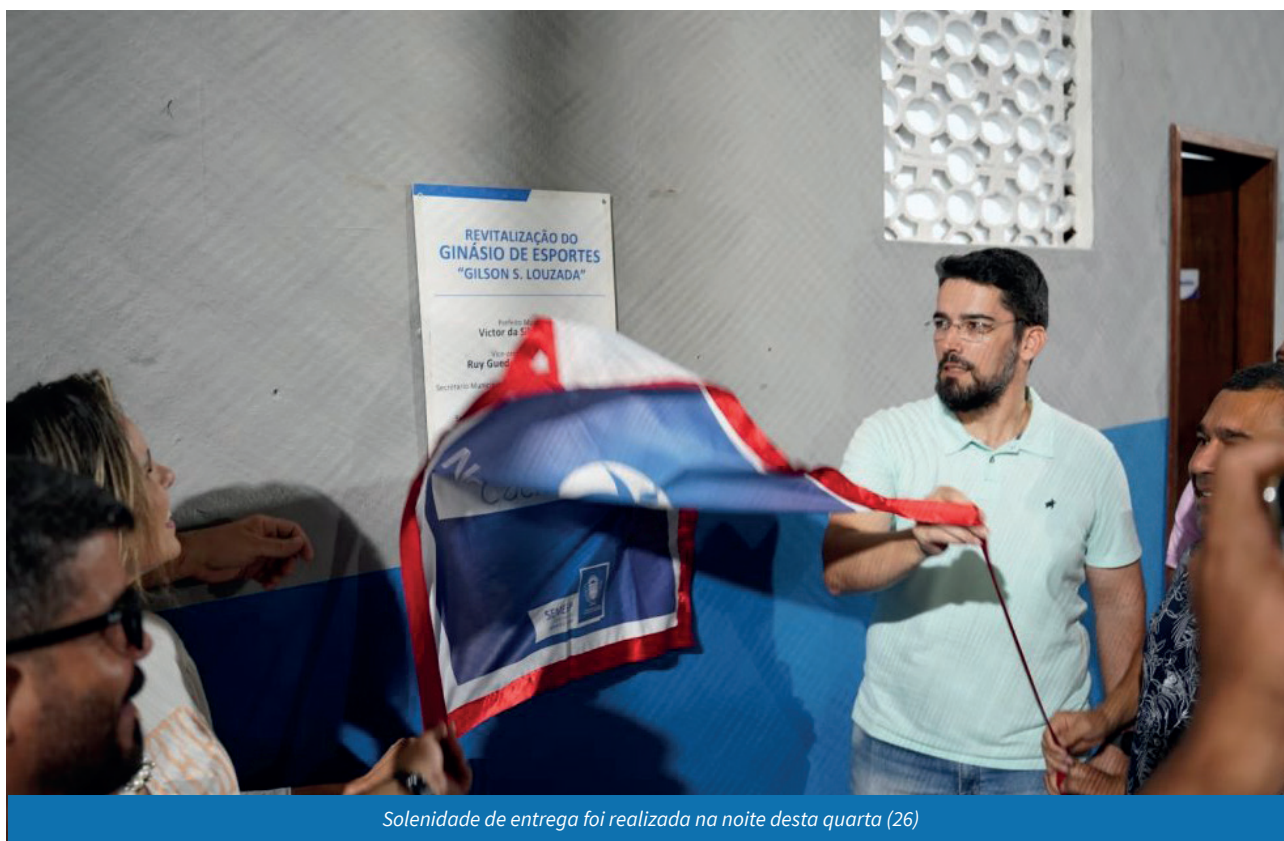
Solenidade de entrega foi realizada na noite desta quarta (26)

incentivar esse crescimento, revitalizando e construindo espaços públicos de esporte e lazer do município. Queremos que a comunidade do Alto Amarelo aproveite bastante esse espaço renovado e nos ajude a cuidar bem dele”, salientou.