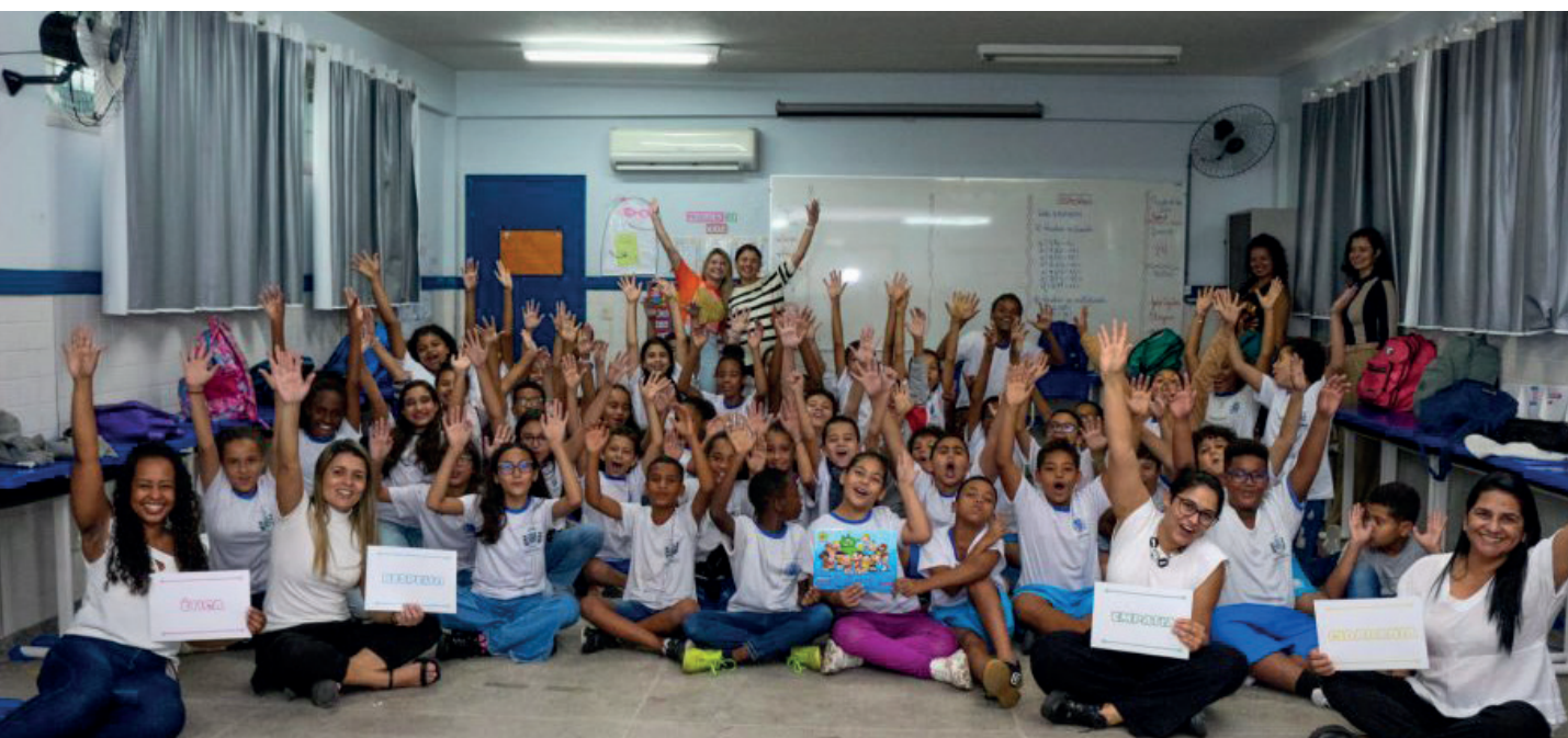
Iniciativa é mais uma ação do cronograma do programa Time Brasil em Cachoeiro