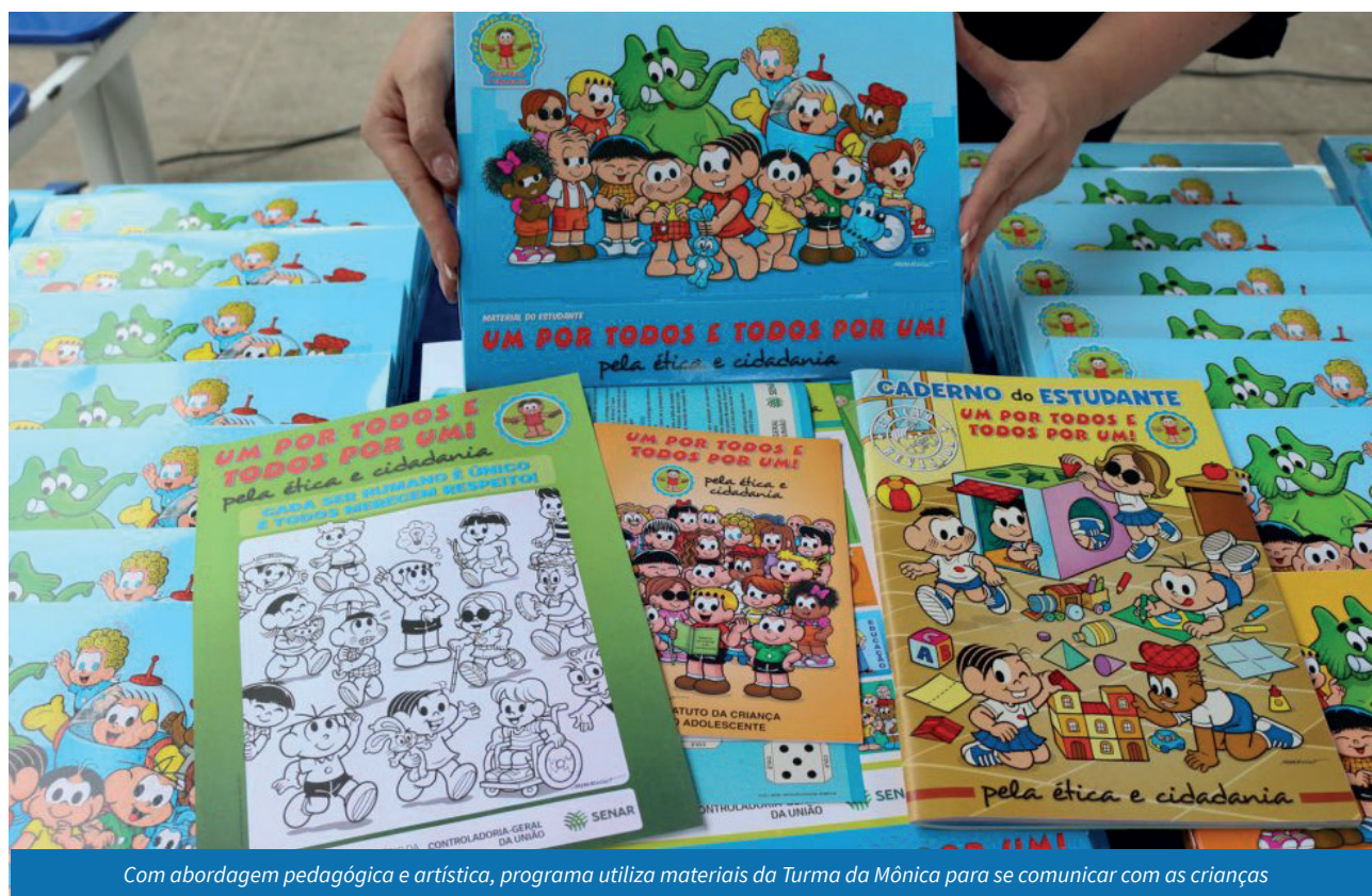
Com abordagem pedagógica e artística, programa utiliza materiais da Turma da Mônica para se comunicar com as crianças