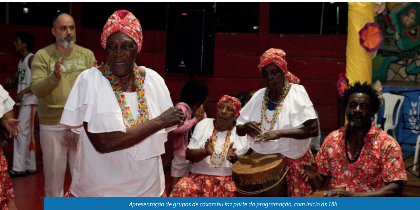
Apresentação de grupos de caxambu faz parte da programação, com início às 18h