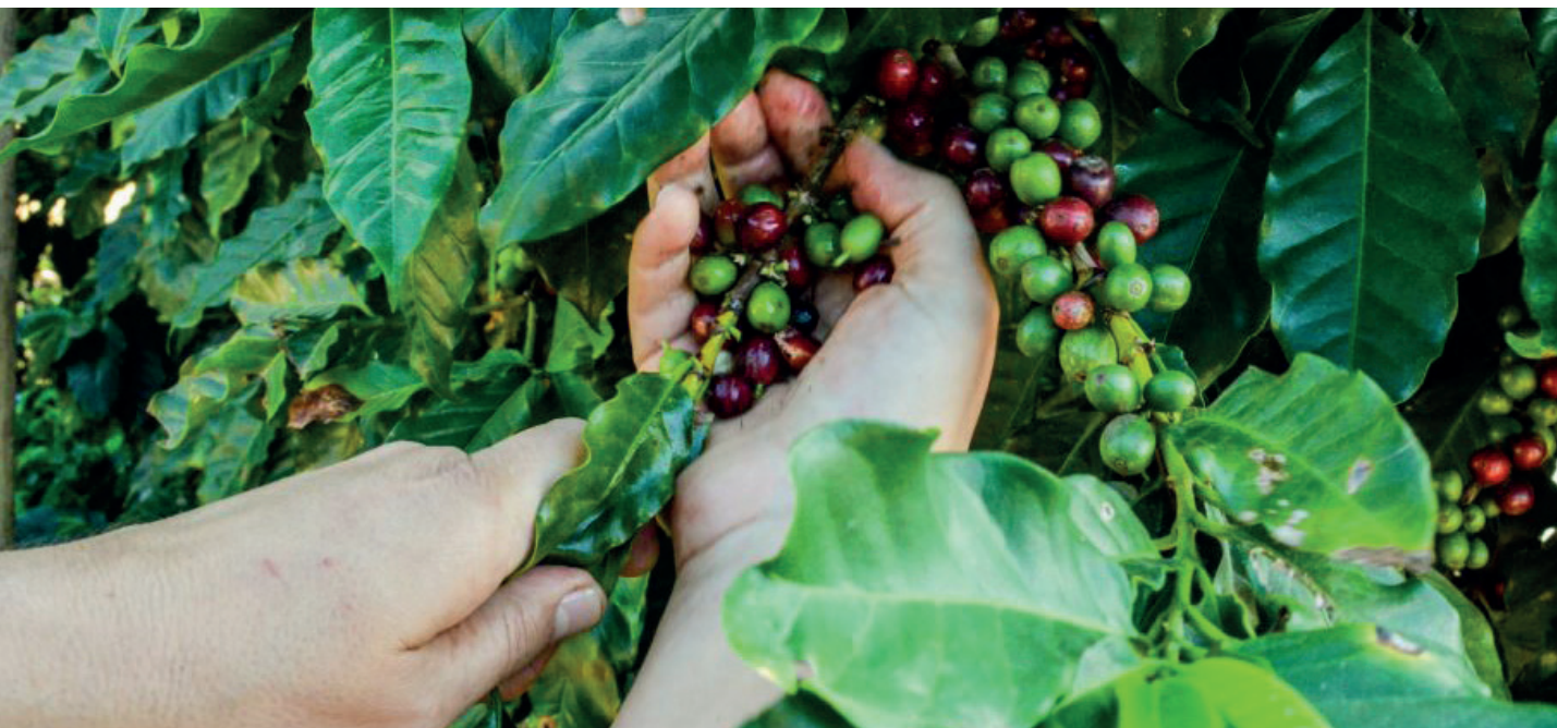
Programação contará com a 1ª Mostra de Café do município