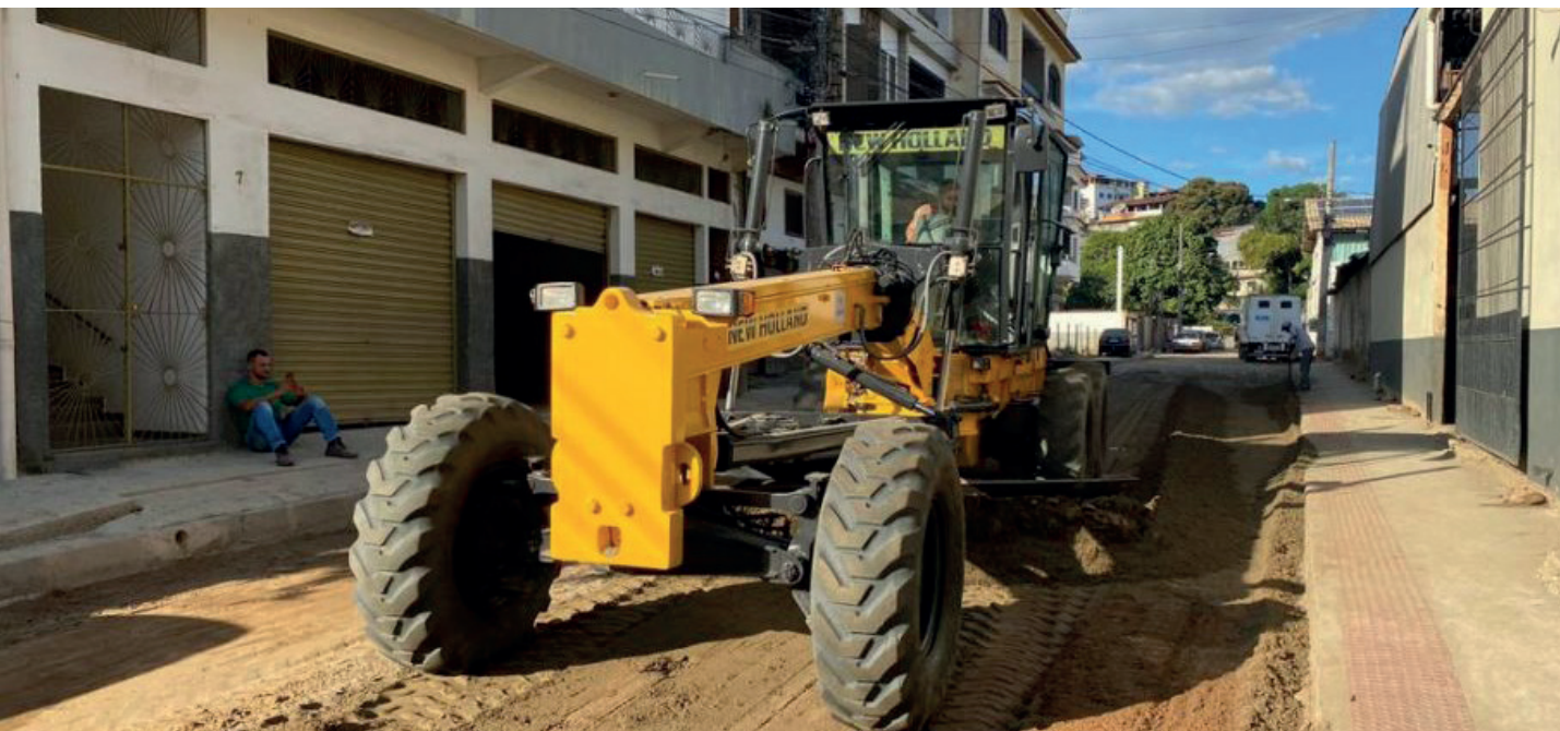
Vias recebem outras melhorias além do asfaltamento