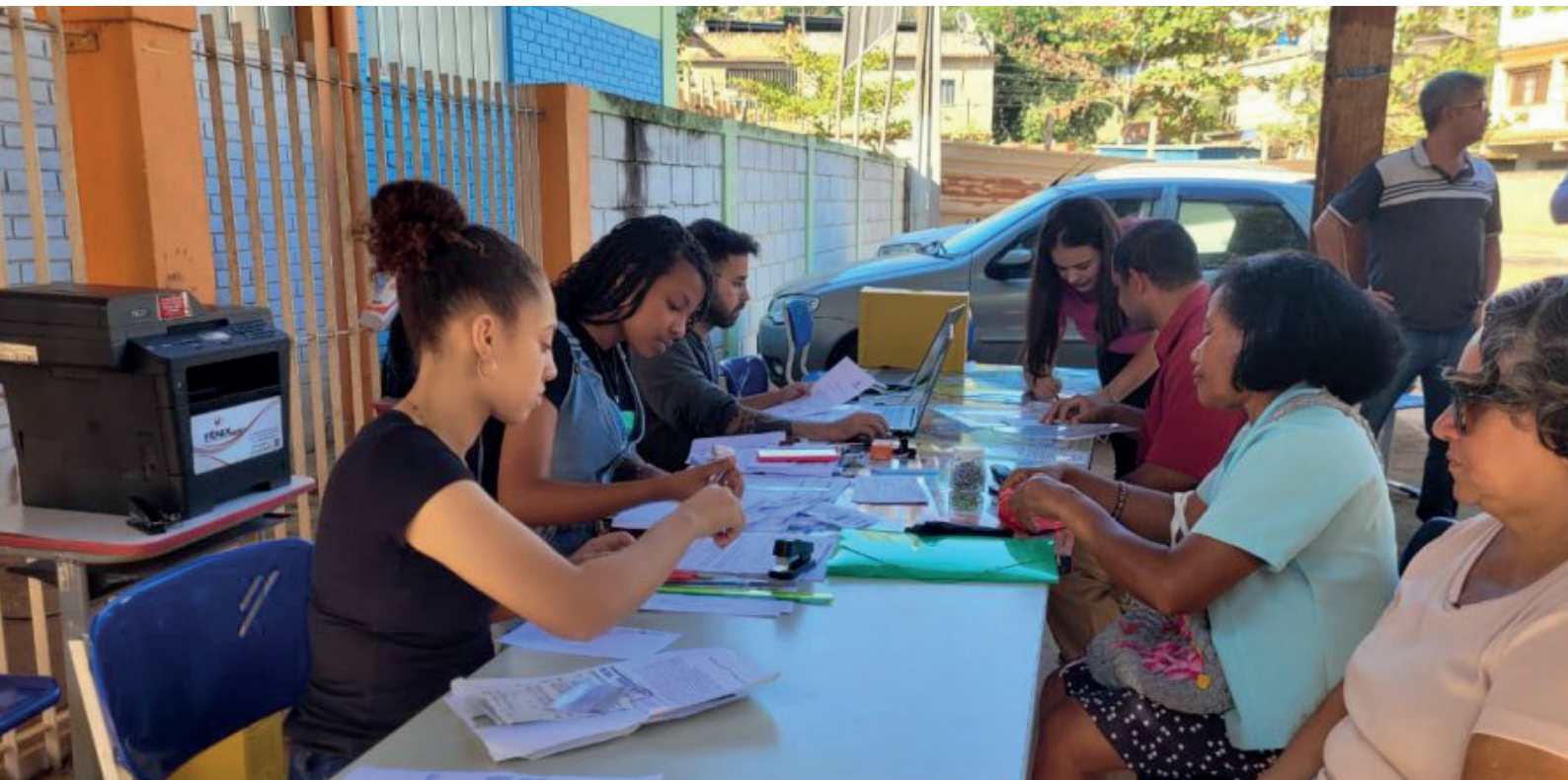
Bairro recebeu segundo mutirão de coleta de documentos na última semana