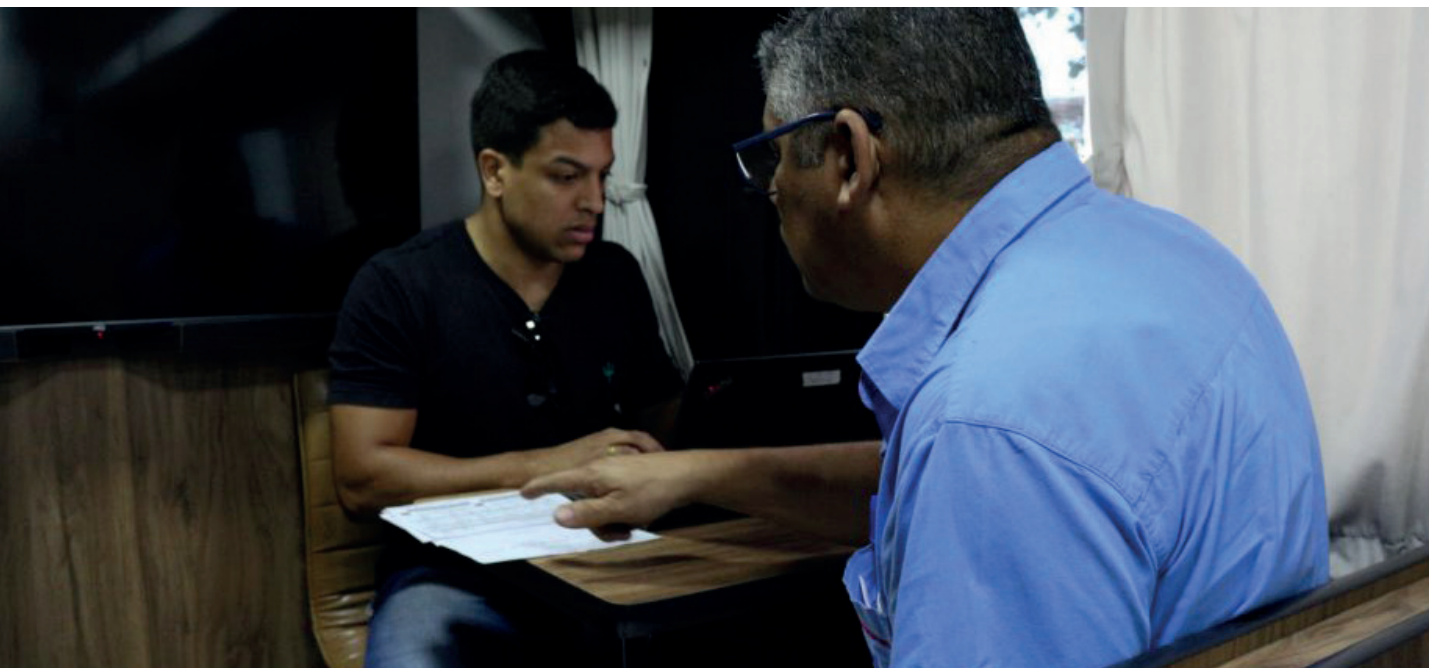
Atendimentos no bairro foram realizados quarta (12) e quinta (13)