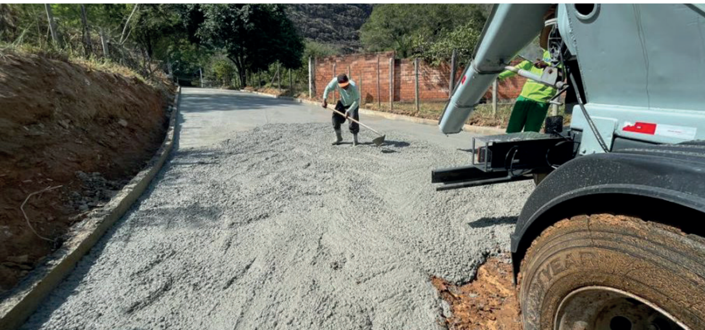
Ruas Rodolfo Marins e Jorge José das Neves estão sendo contempladas