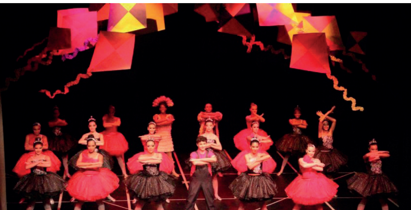
Serão destinados mais de R$ 600 mil para a execução das propostas aprovadas