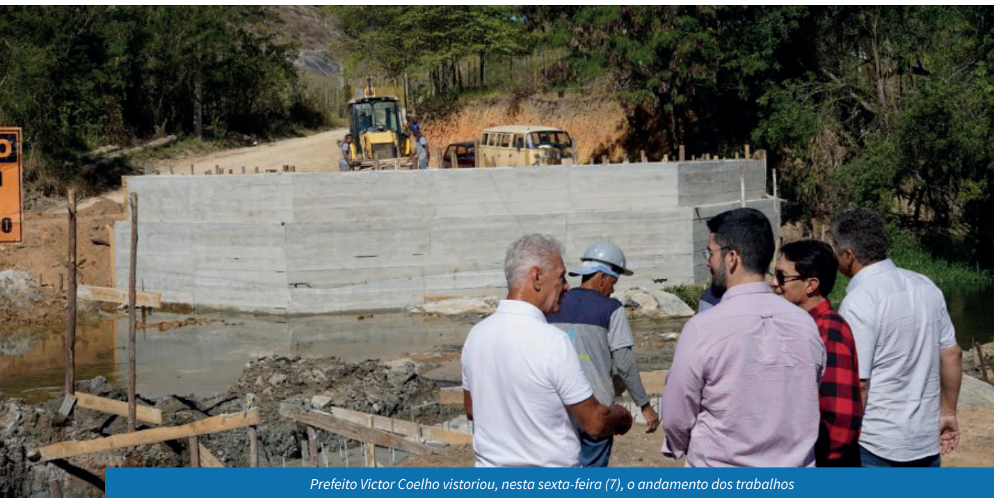
Prefeito Victor Coelho vistoriou, nesta sexta-feira (7), o andamento dos trabalhos