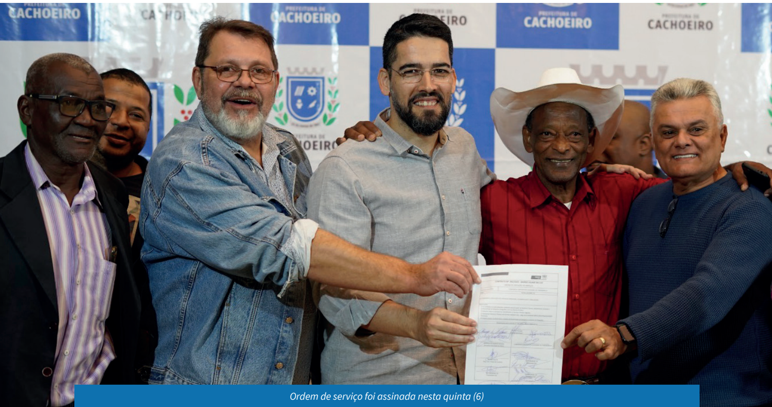
Ordem de serviço foi assinada nesta quinta (6)