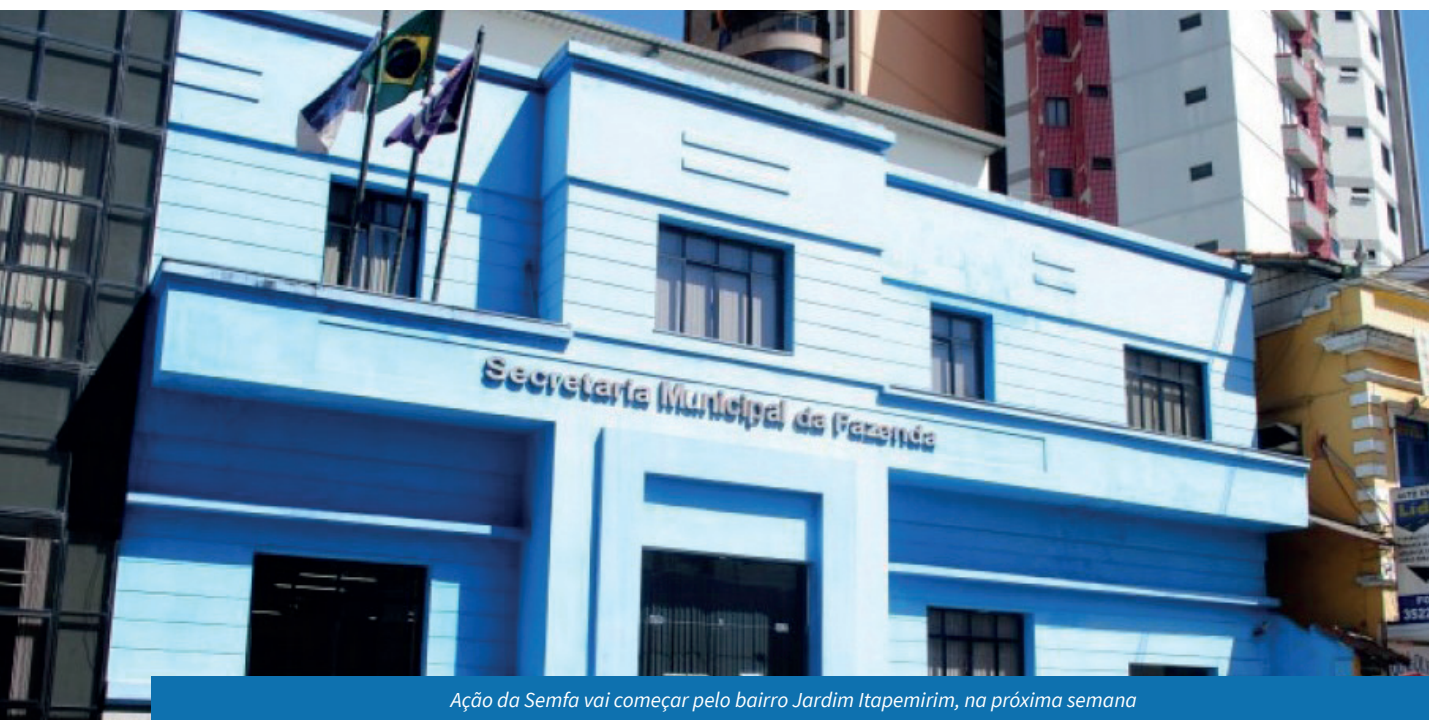
Ação da Semfa vai começar pelo bairro Jardim Itapemirim, na próxima semana