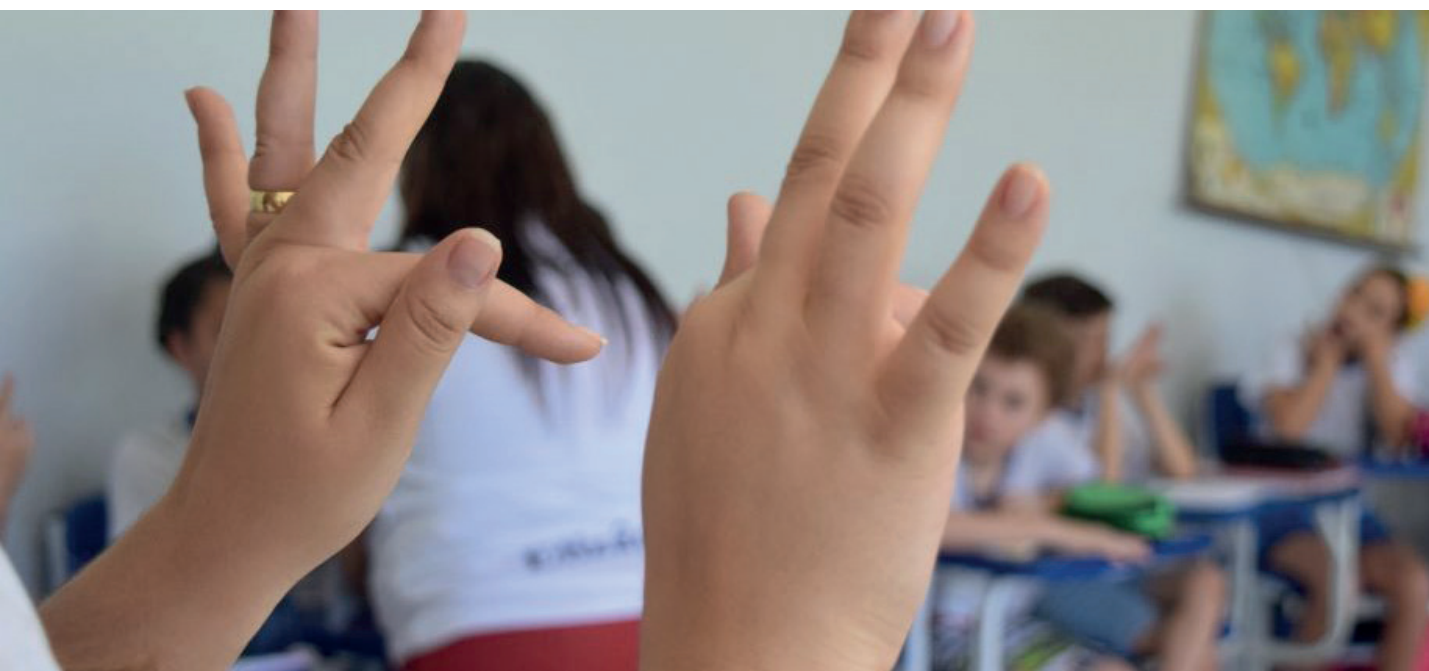
Educadores da rede municipal de ensino e o público externo podem participar