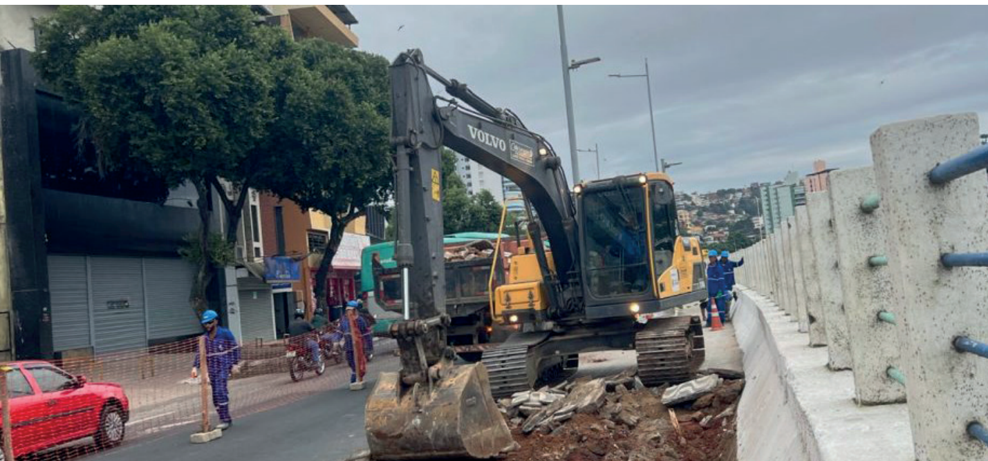
A previsão é que os trabalhos sejam concluídos no próximo sábado (8)