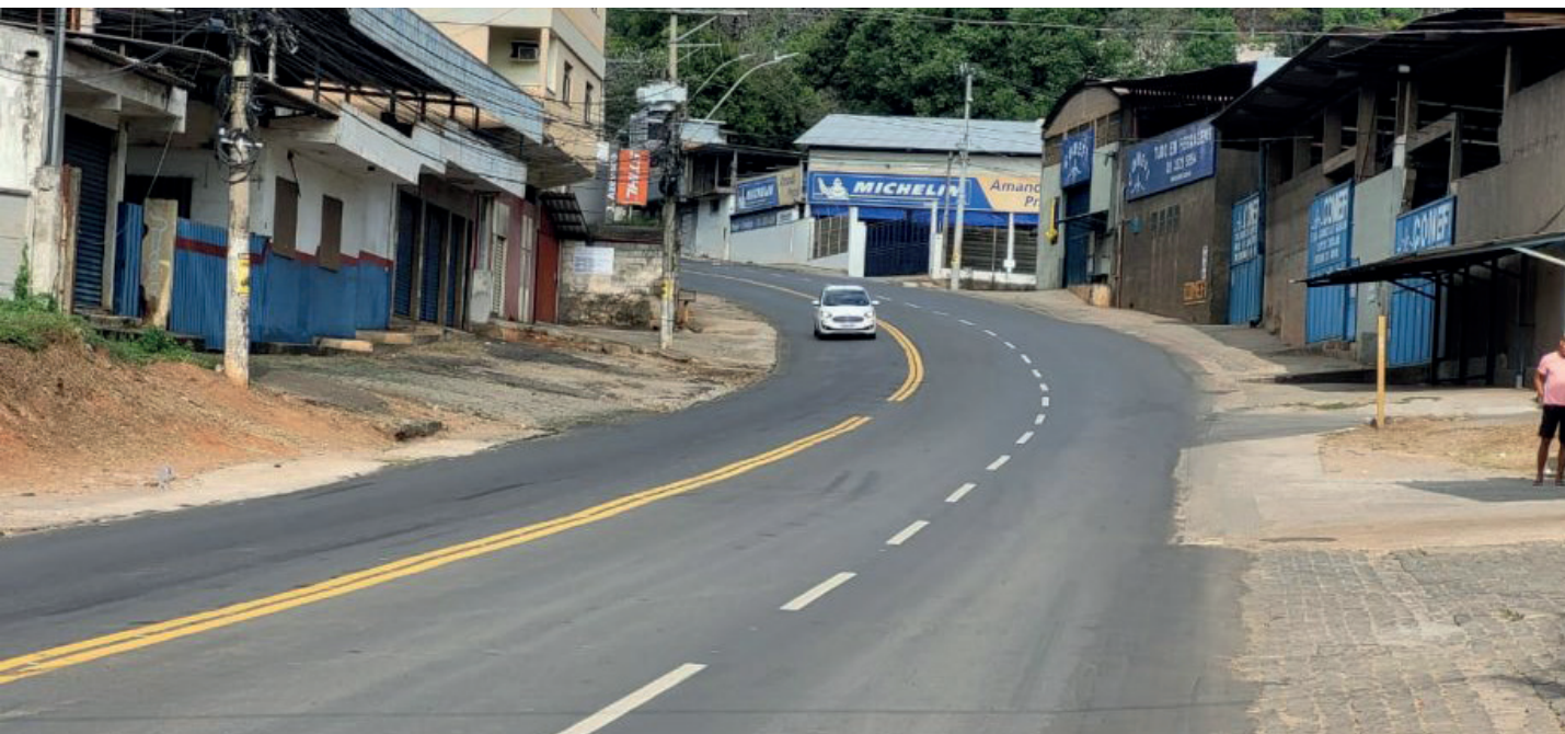
Na última semana, foram feitas algumas das principais marcações horizontais