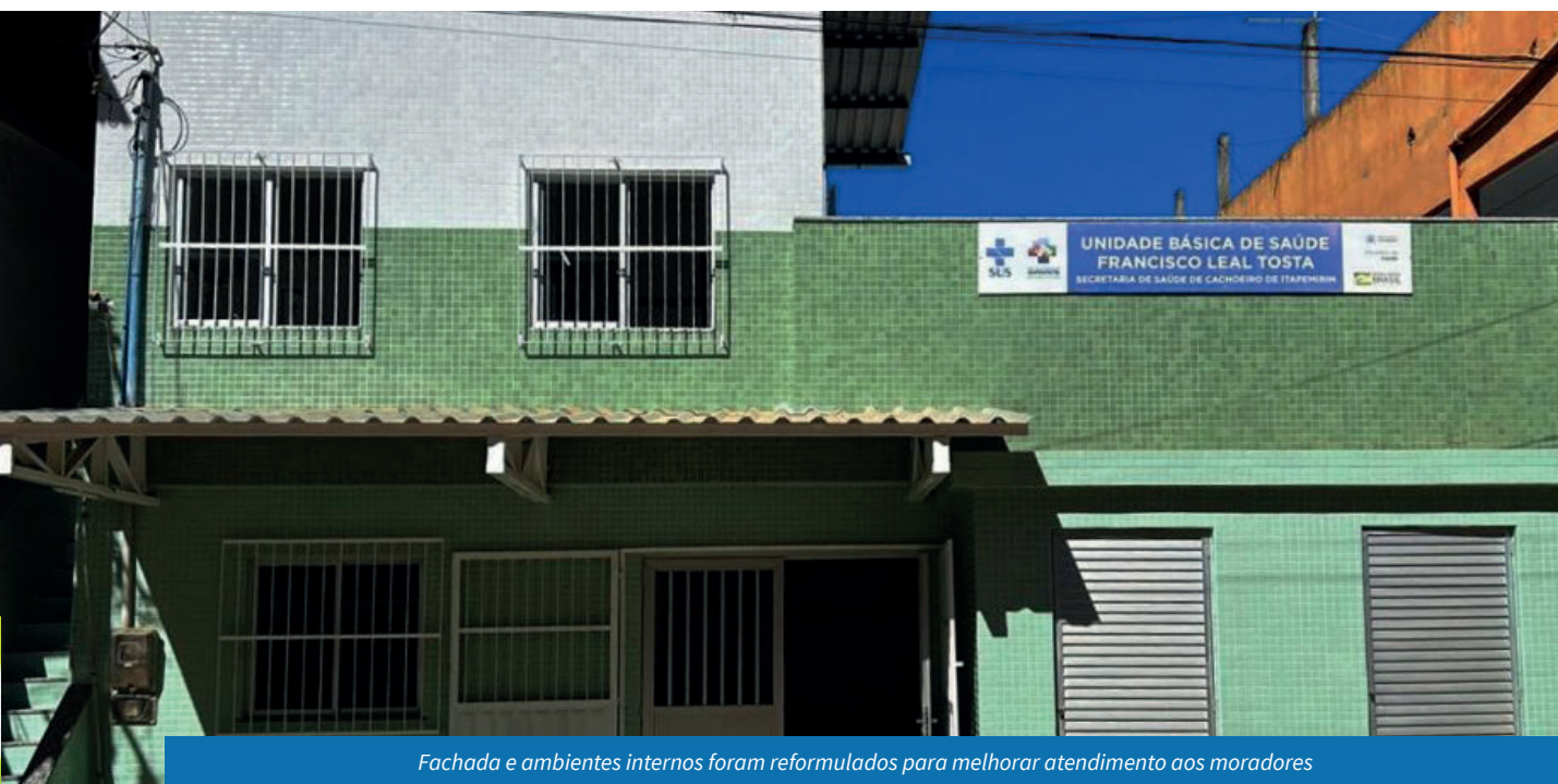
Fachada e ambientes internos foram reformulados para melhorar atendimento aos moradores