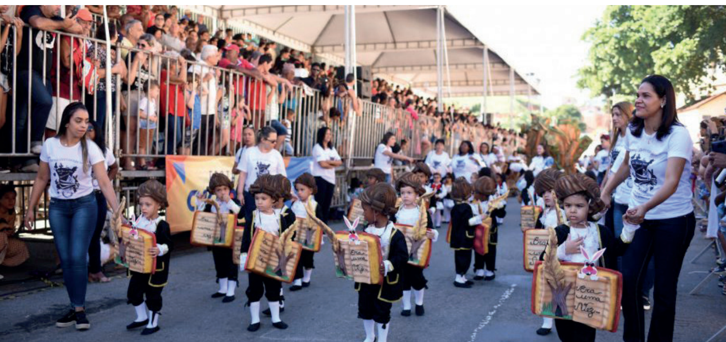
Evento retorna à programação depois de três anos suspenso, por conta da pandemia