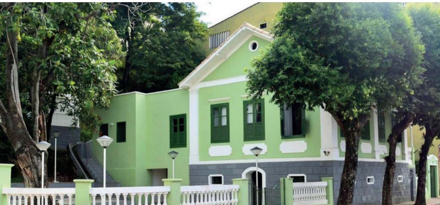
Encontros estão sendo realizados na Casa dos Braga