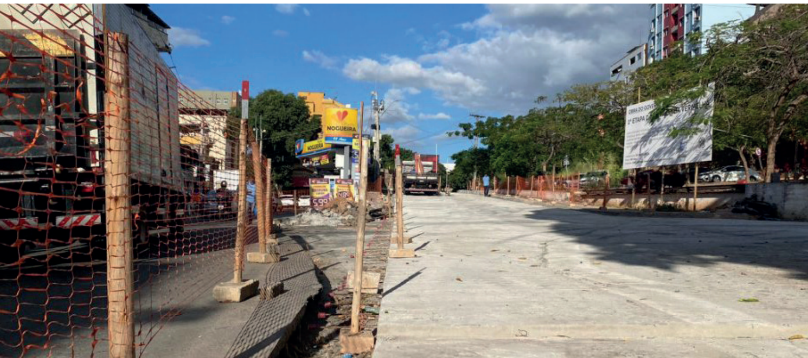
Na rua Bernardo Horta, trânsito será desviado para o acesso à Linha Vermelha recém-pavimentado