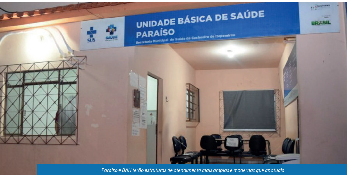
Paraíso e BNH terão estruturas de atendimento mais amplas e modernas que as atuais