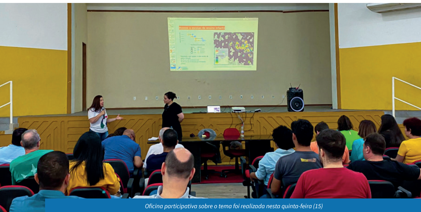
Oficina participativa sobre o tema foi realizada nesta quinta-feira (15)