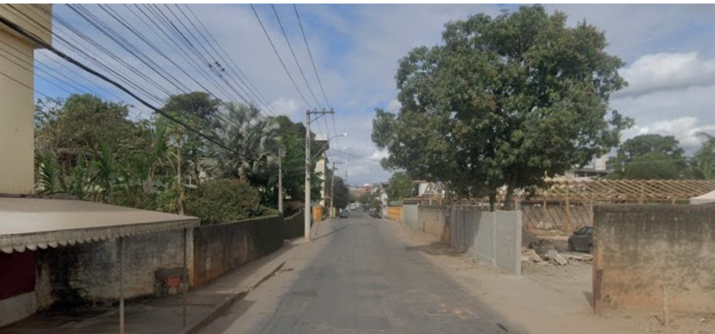
Trecho da via será interditado a partir de terça-feira (20)