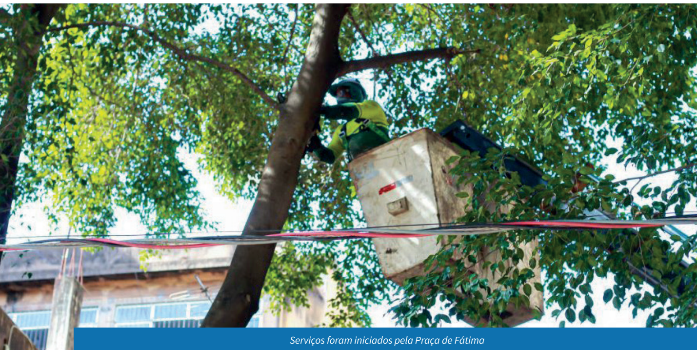
Serviços foram iniciados pela Praça de Fátima