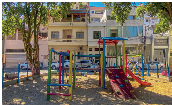
Brinquedos ganharam manutenção e novas cores

“Proporcionar ambientes bonitos e confortáveis para práticas esportivas e de lazer é um dos compromissos da nossa gestão. Essa praça e essa quadra são importantes para o moradores da região, e temos certeza de que esse espaço será muito bem utilizados por eles”, disse o prefeito de Cachoeiro, Victor Coelho.