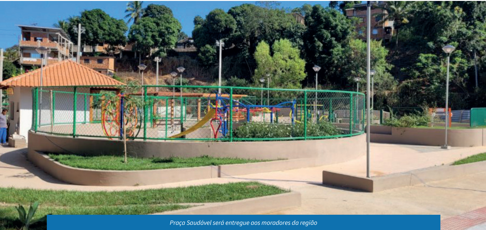
Praça Saudável será entregue aos moradores da região