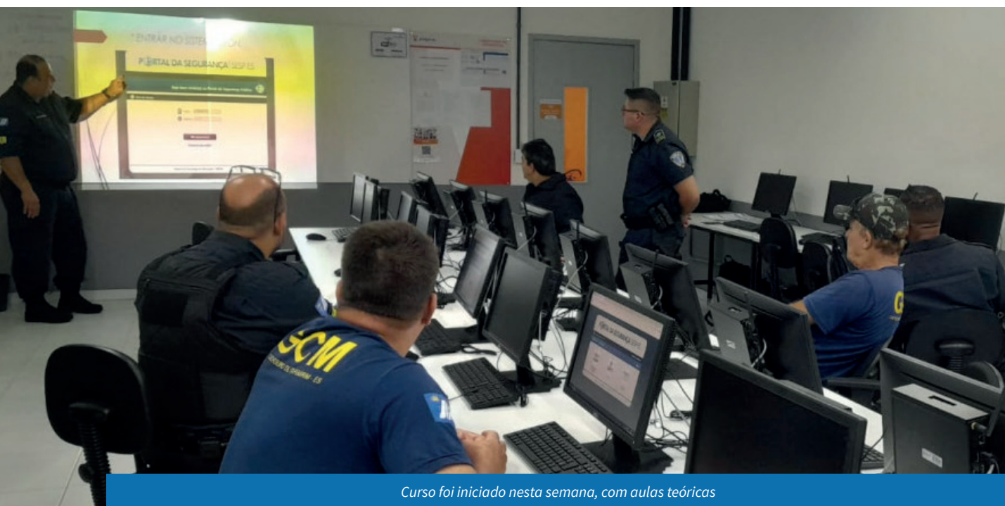
Curso foi iniciado nesta semana, com aulas teóricas