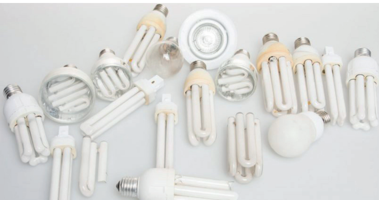
Ponto de recolhimento vai funcionar na Praça de Fátima