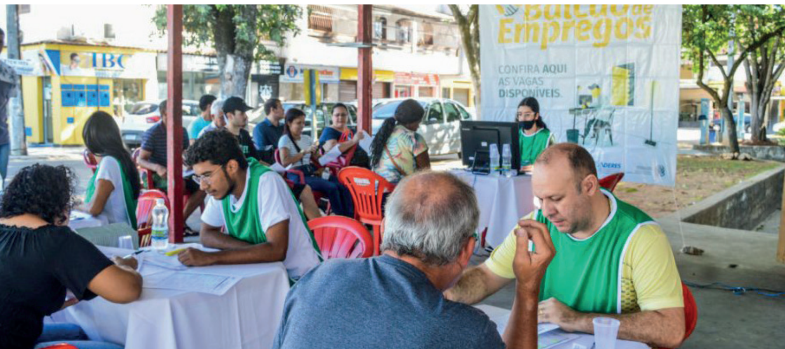
Uma das ações confirmadas é o Balcão de Empregos