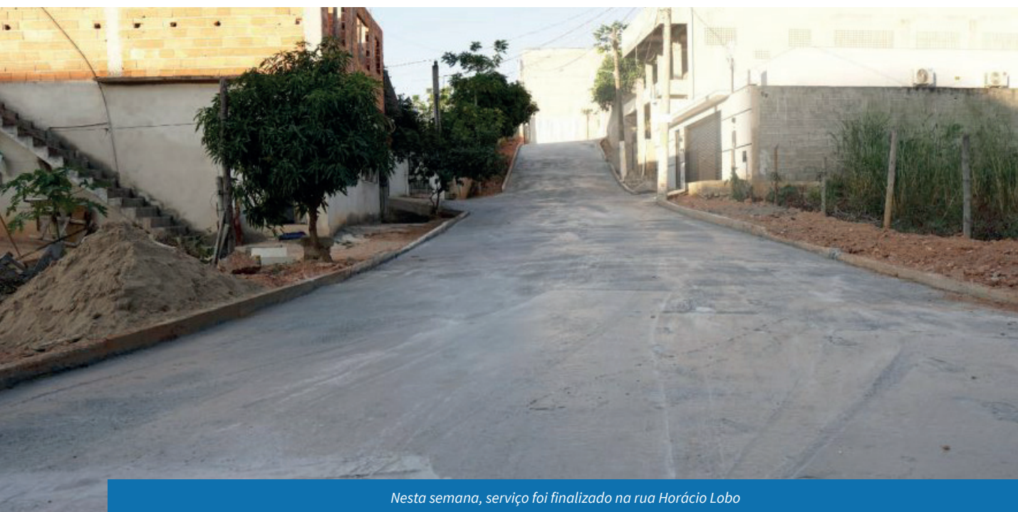
Nesta semana, serviço foi finalizado na rua Horácio Lobo