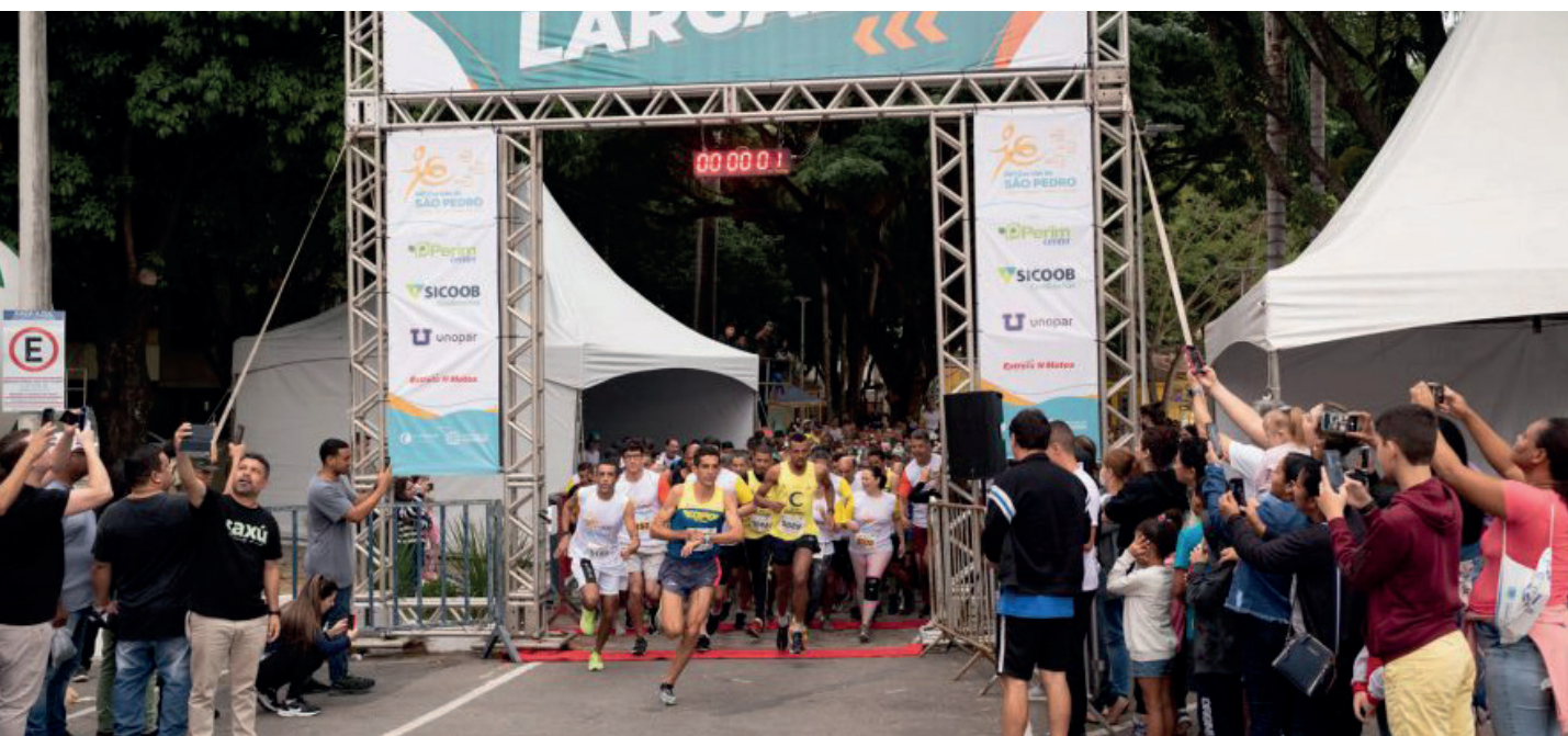
Edição 2023 terá 2 mil vagas para a prova principal e 500 para a categoria Kids