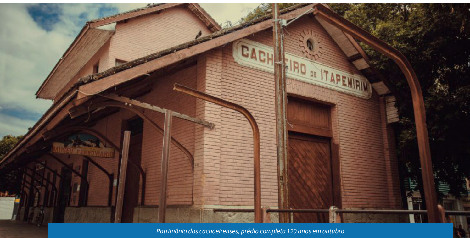
Patrimônio dos cachoeirenses, prédio completa 120 anos em outubro