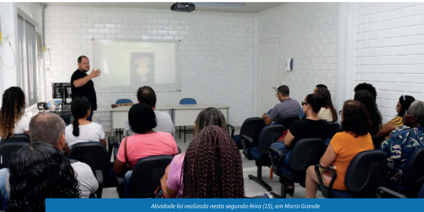
Atividade foi realizada nesta segunda-feira (15), em Morro Grande