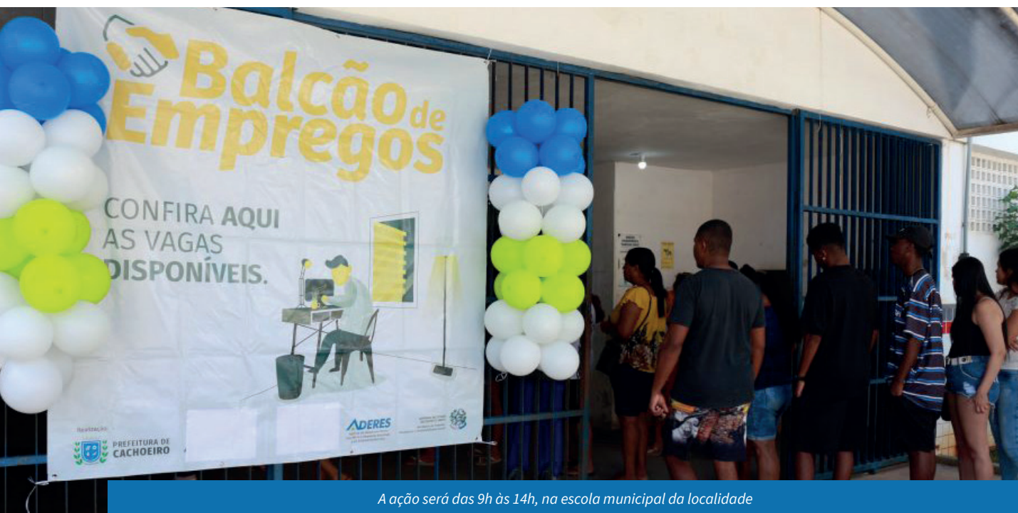
A ação será das 9h às 14h, na escola municipal da localidade