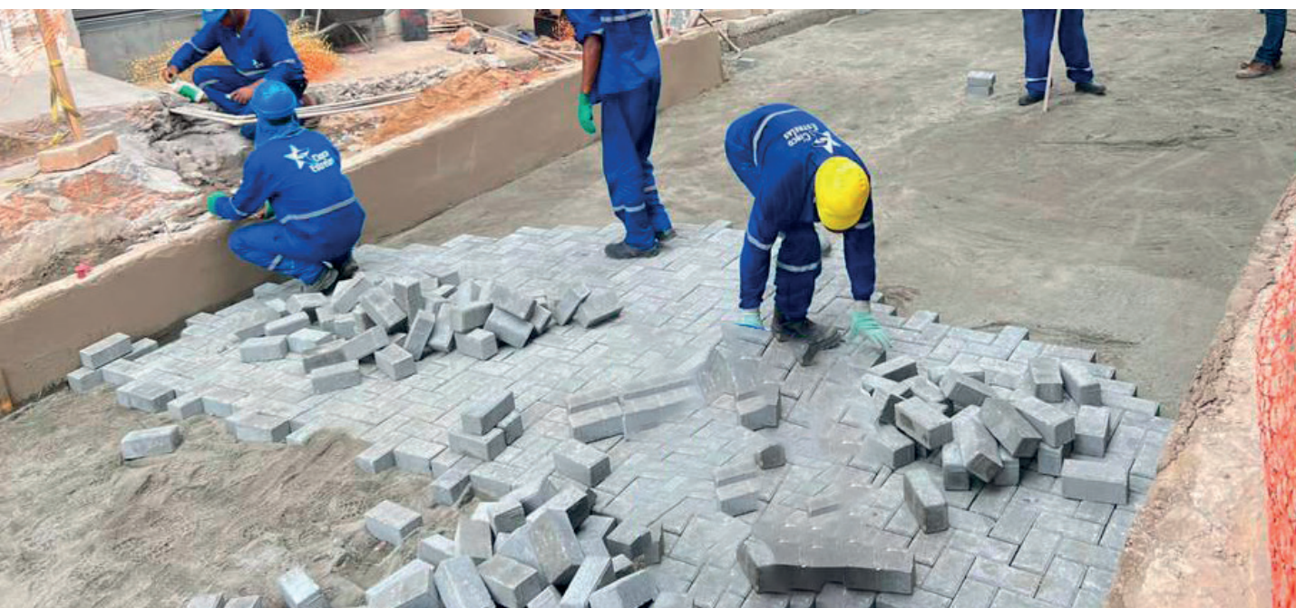
Blocos de concreto começaram a ser aplicados nesta terça-feira (9)