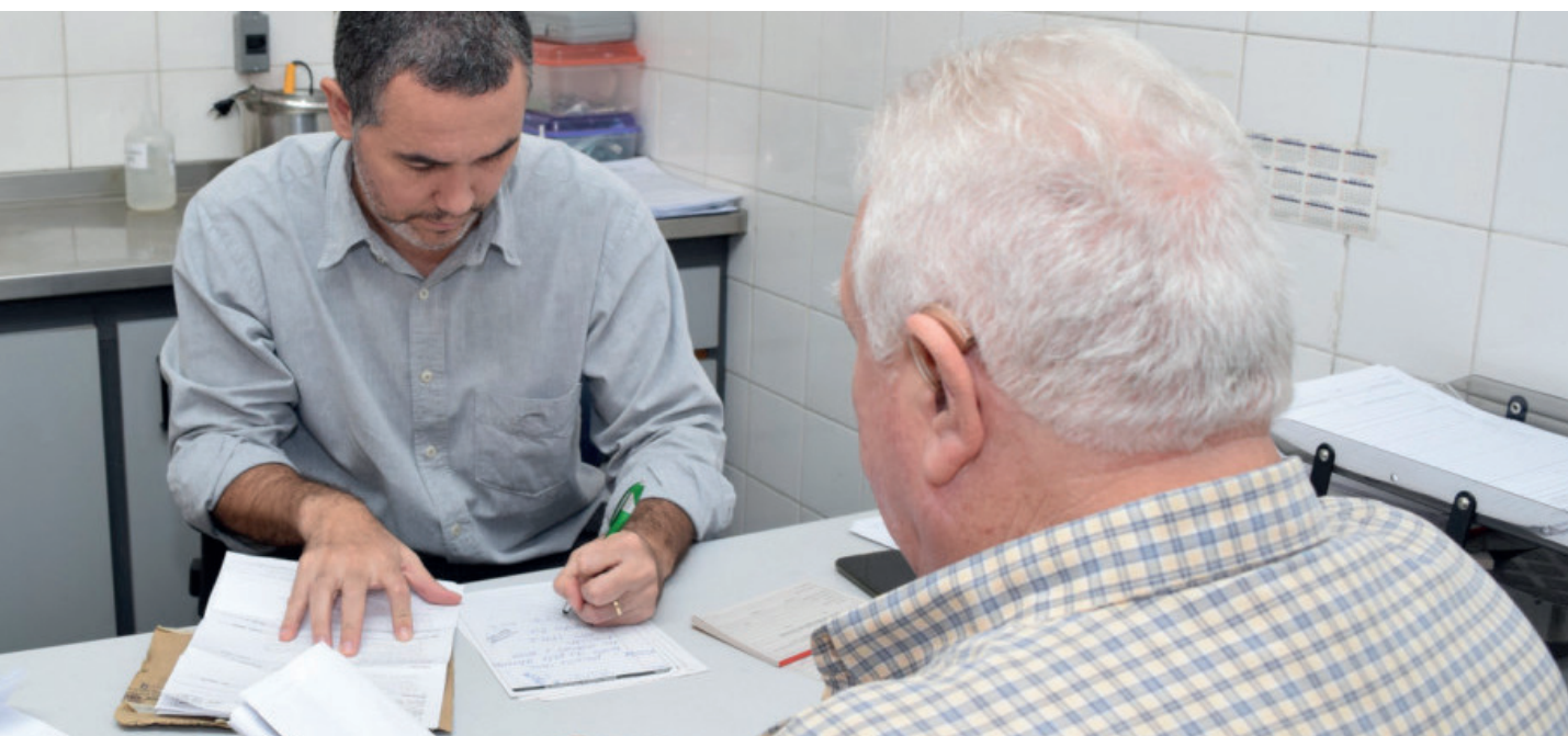
Investimento faz parte do programa de qualificação da estrutura de atendimento da rede municipal de saúde