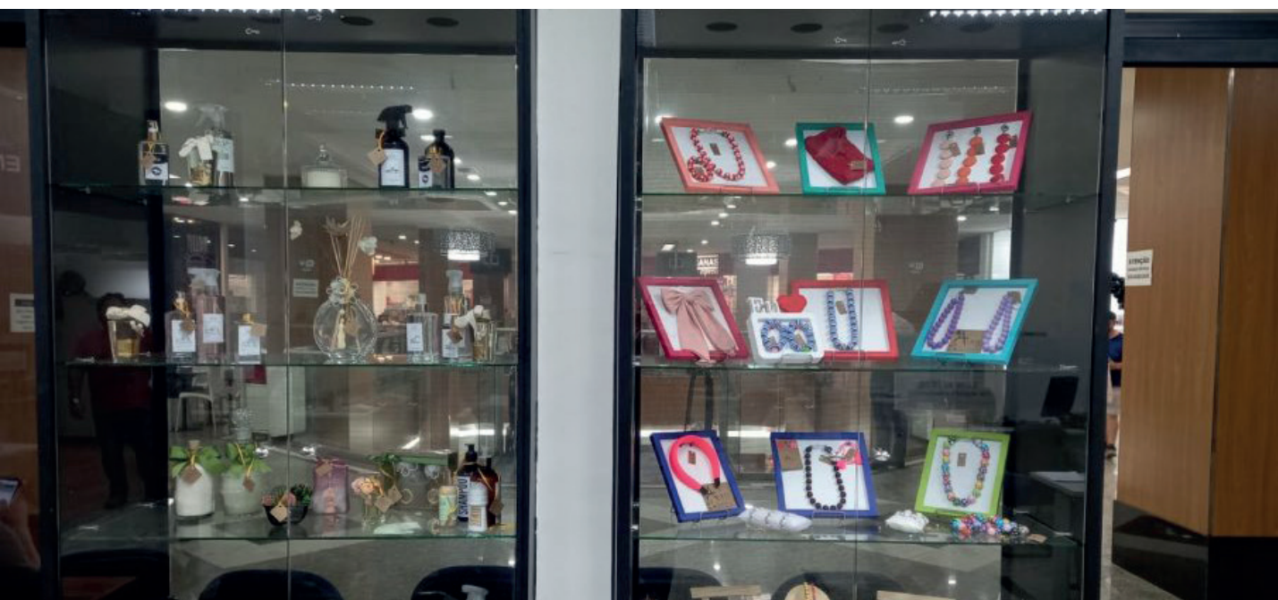
Com a iniciativa, empreendedores que não possuem loja física têm a oportunidade de expor seus produtos