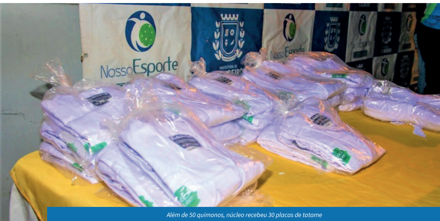
Além de 50 quimonos, núcleo recebeu 30 placas de tatame