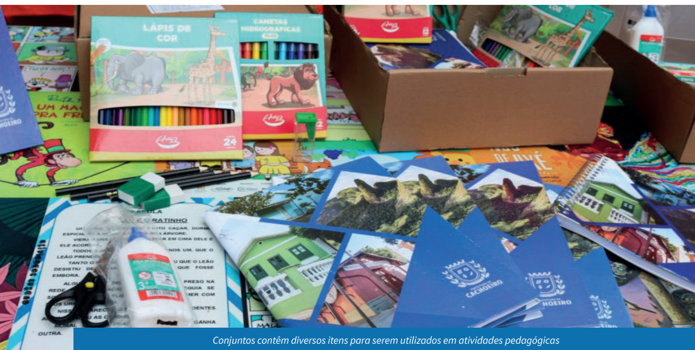
Conjuntos contêm diversos itens para serem utilizados em atividades pedagógicas