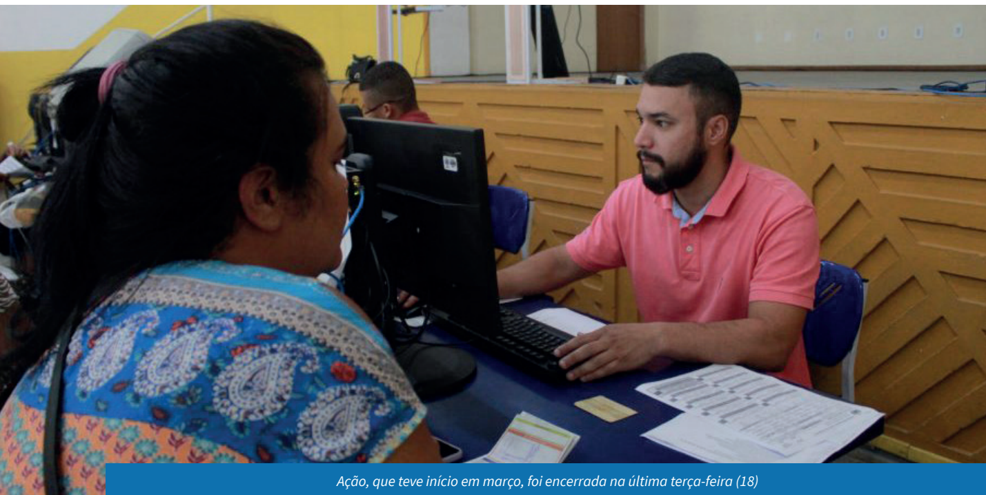
Ação, que teve início em março, foi encerrada na última terça-feira (18)