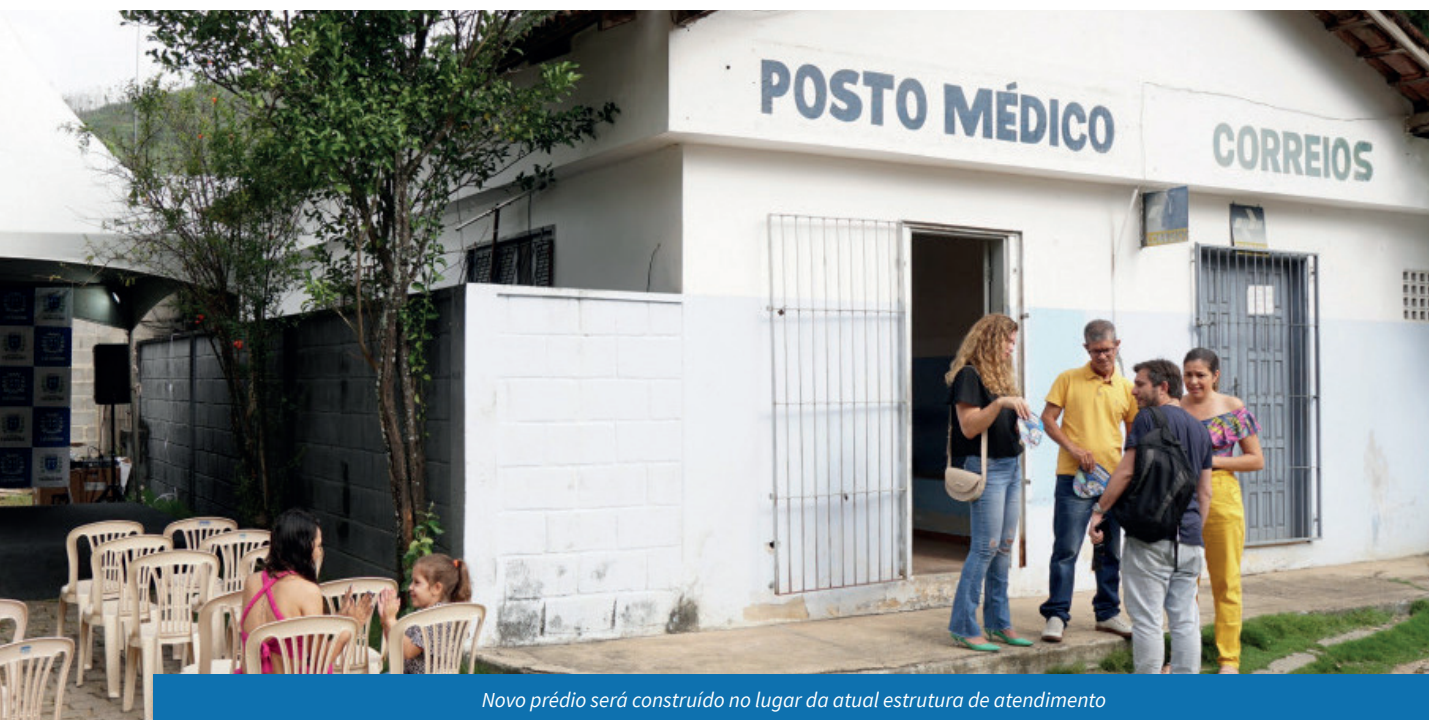
Novo prédio será construído no lugar da atual estrutura de atendimento