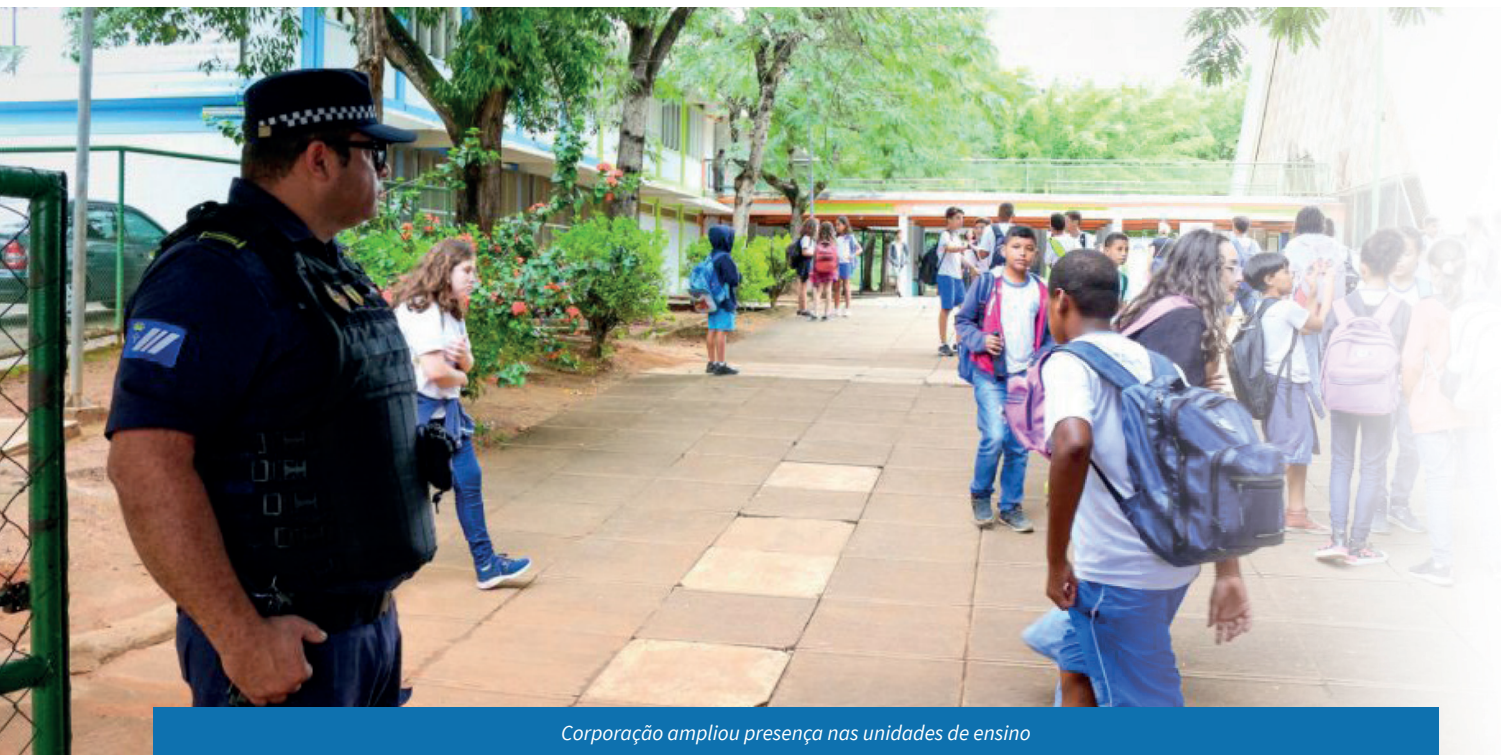
Corporação ampliou presença nas unidades de ensino