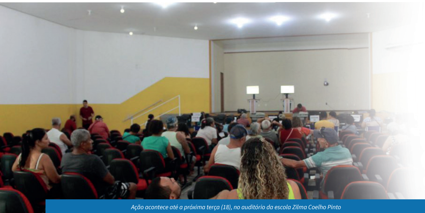
Ação acontece até a próxima terça (18), no auditório da escola Zilma Coelho Pinto