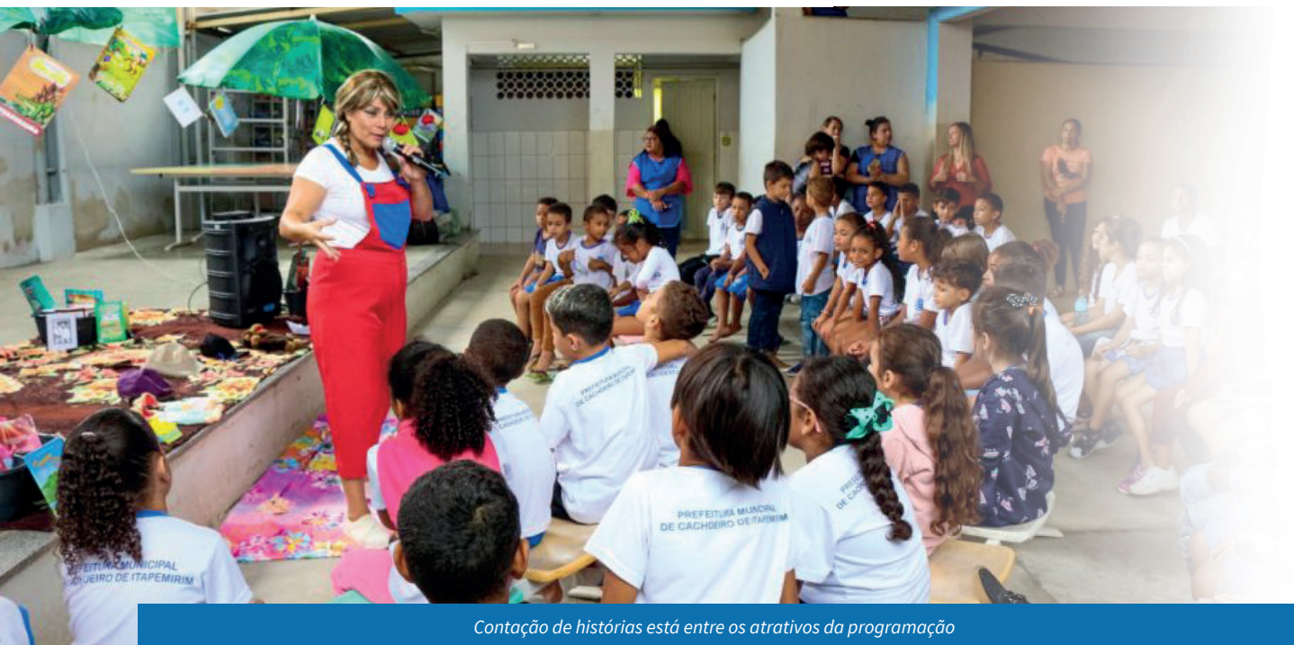
Contação de histórias está entre os atrativos da programação