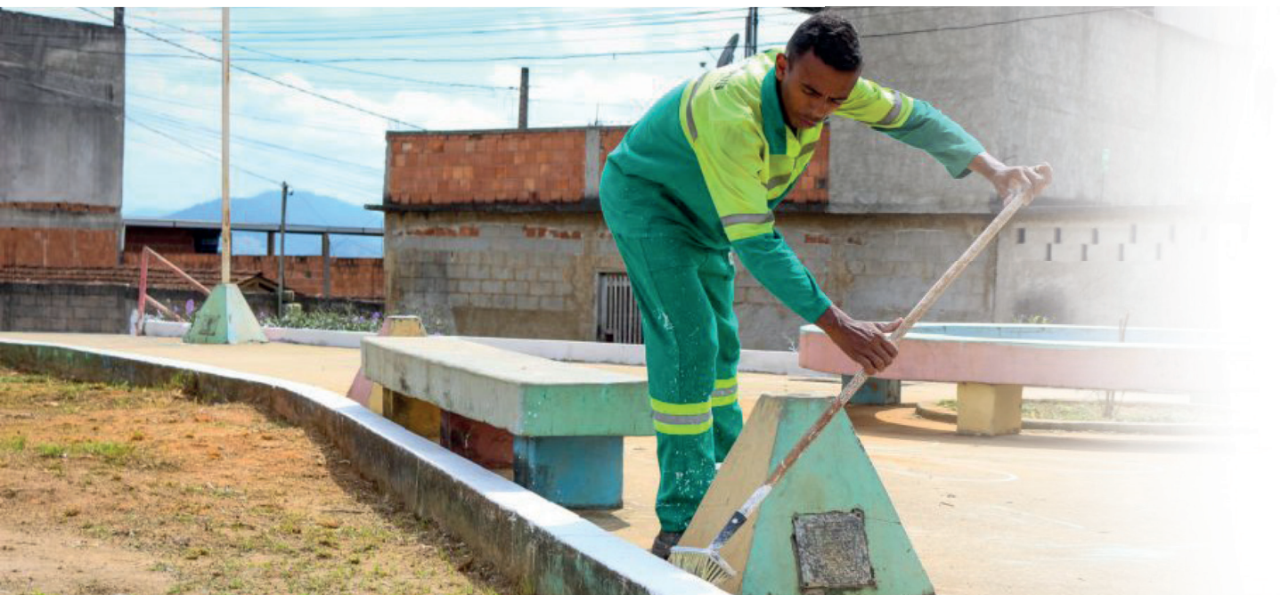
Trabalhos tiveram início na última segunda-feira (3)