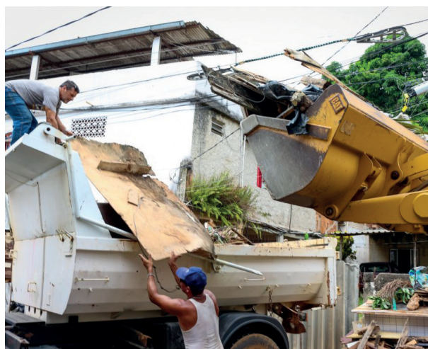
Limpeza de vias é um dos serviços executados