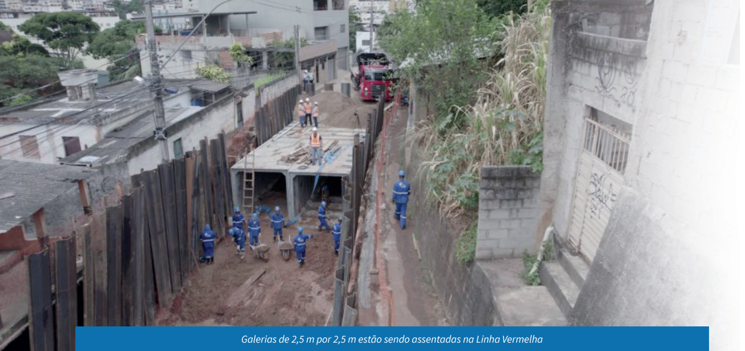
Galerias de 2,5 m por 2,5 m estão sendo assentadas na Linha Vermelha