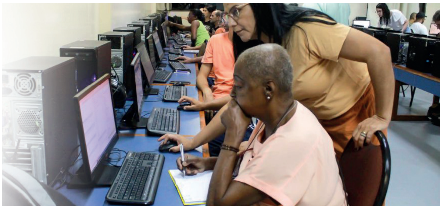
Projeto já teve dois encontros realizados