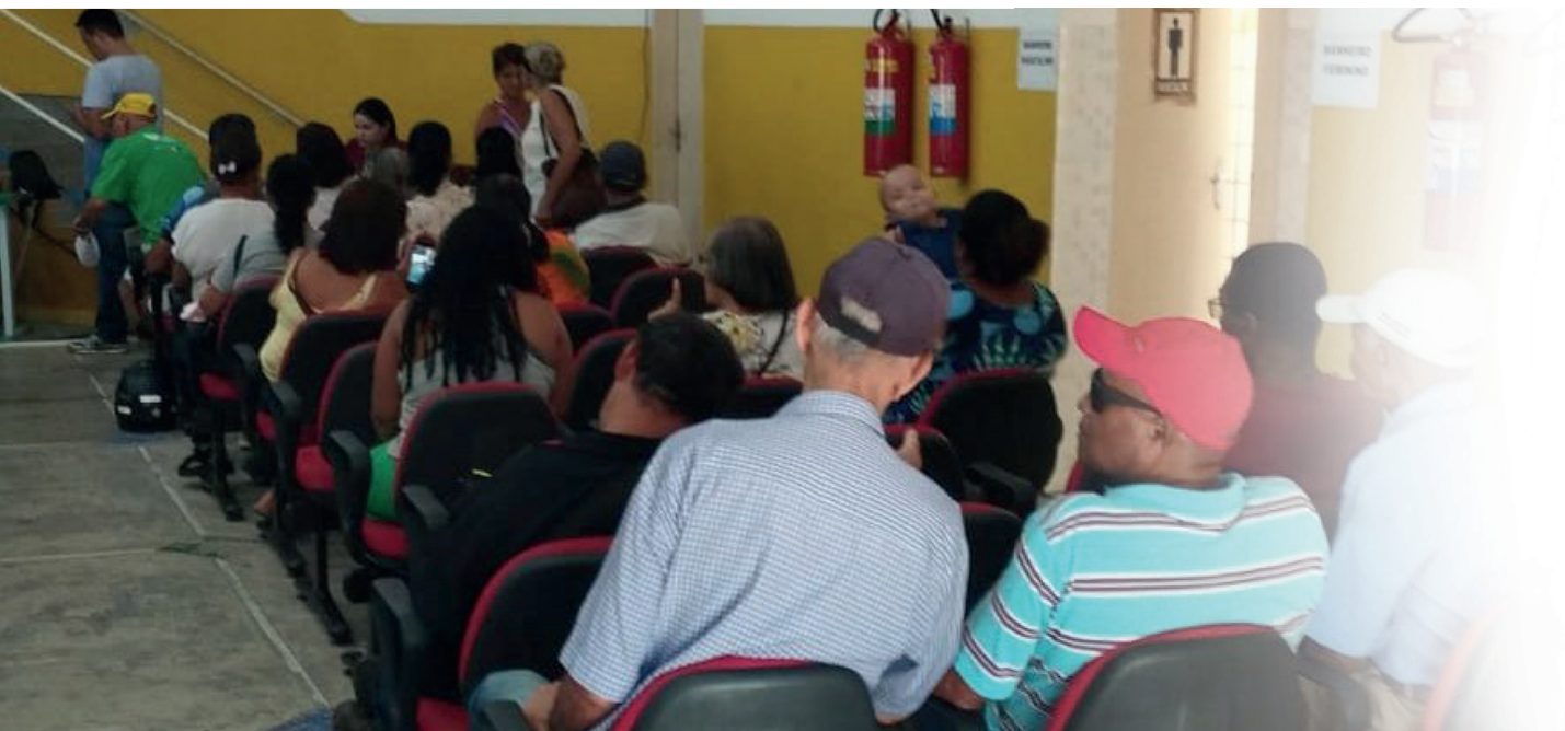
Ação acontece na Escola Municipal “Zilma Coelho Pinto”