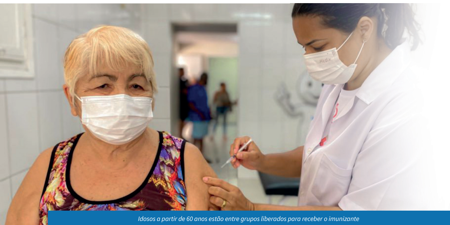
Idosos a partir de 60 anos estão entre grupos liberados para receber o imunizante