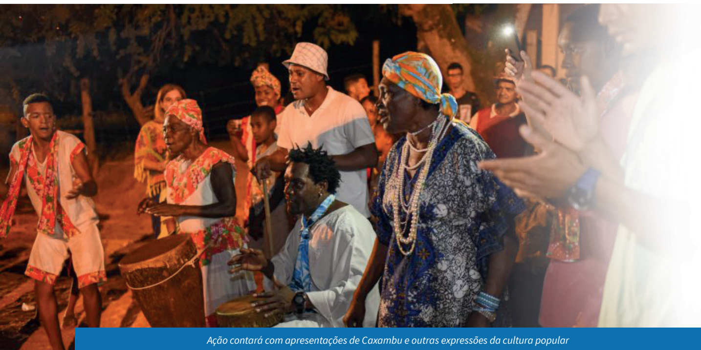
Ação contará com apresentações de Caxambu e outras expressões da cultura popular