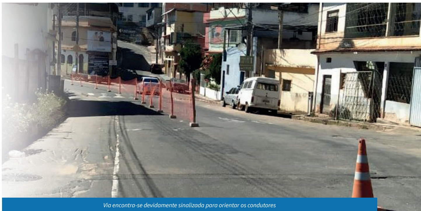
Via encontra-se devidamente sinalizada para orientar os condutores