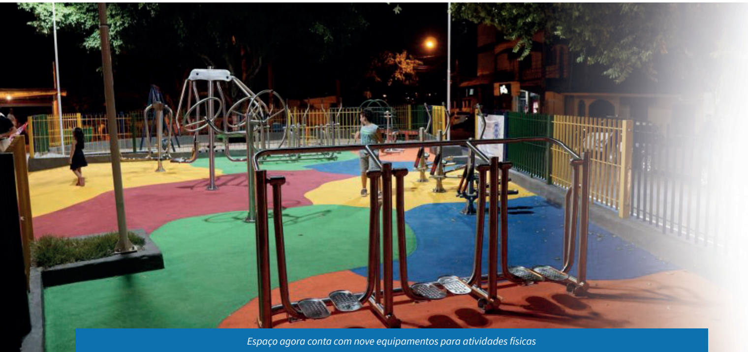
Espaço agora conta com nove equipamentos para atividades físicas