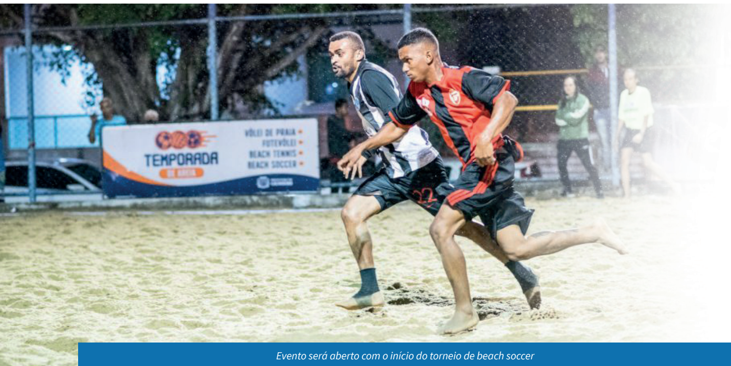
Evento será aberto com o início do torneio de beach soccer