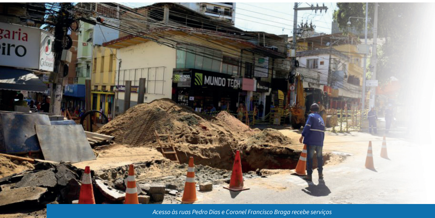
Acesso às ruas Pedro Dias e Coronel Francisco Braga recebe serviços