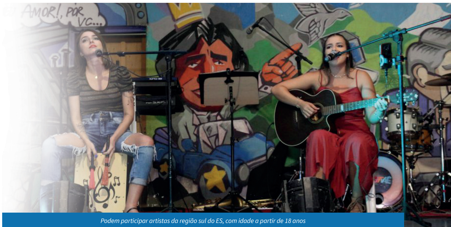
Podem participar artistas da região sul do ES, com idade a partir de 18 anos