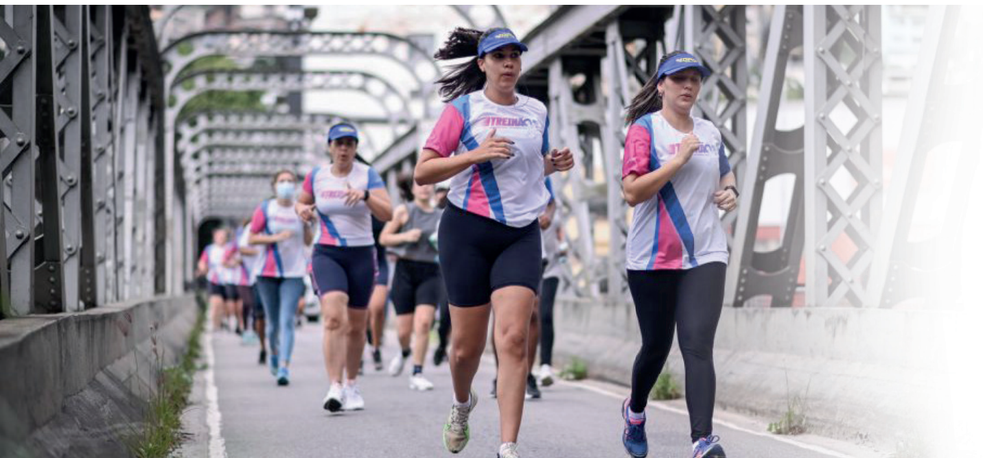
Percurso da corrida terá 5km e inclui vias centrais